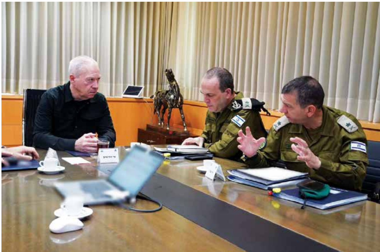
ראש אמ"ן אהרון חליוה בפגישה עם שר הביטחון יואב גלנט, במהלך המלחמה. העלאת ספקות בנוגע לקונספציה יכולה להוביל למסקנות חשובות על השינויים הנדרשים בהיערכות.

בנושא חמאס מורתע. 35 מאותה הסיבה אפשרה ישראל לקטר להכניס לעזה מאות מיליוני דולרים, ולהעניק לתושבי עזה היתרי עבודה בישראל.