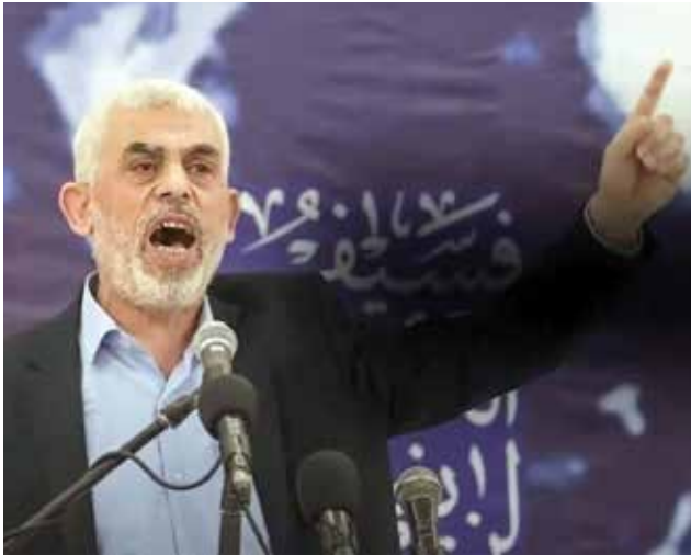
יחיא סנואר - "חמאס מורתע". טעות בהערכת כוונותיו של מנהיג אויב יכולה להיות בעלת משמעויות מרחיקות לכת.

והיא הגיעה מהדרג המדיני, משיקולים מדיניים, וזלגה אל תוך המערכת הביטחונית - ללא ניסיון אמיתי של מערכת הביטחון והמטה לביטחון לאומי לאתגר את תקפותה. גם כאשר היו הערכות מודיעין בודדות בדבר כוונות חמאס לתקוף, הן התנפצו על שובר הגלים של הקונספציה.