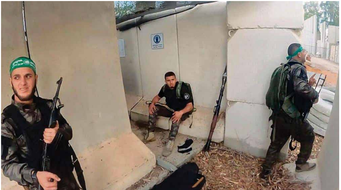
מחבלי חמאס באחד מבסיסי צה"ל. מערכת הביטחון טעתה ולא הבינה שפעילי חמאס חיכו בסבלנות להזדמנות, ולא באמת שינו את תפיסתם האסטרטגית.

מתקפת הפתע של חמאס ב־7 באוקטובר הייתה הפתעה אסטרטגית כואבת לישראל. מבחינת סוגי ההפתעות, זו הייתה "הפתעה מרוכזת", משמע - המודיעין של המותקף היה שאנן וטעה בהערכת הכוונות של יעד המודיעין, אף שהכירו היטב. באחריות ראשי המודיעין לאתגר באופן שוטף כל קונספציה, וחבל שהמלצת ועדת אגרנט להקמת גוף מקצועי ואיכותי בתוך המודיעין, אשר יעסוק בכך, התמוססה בשנים האחרונות