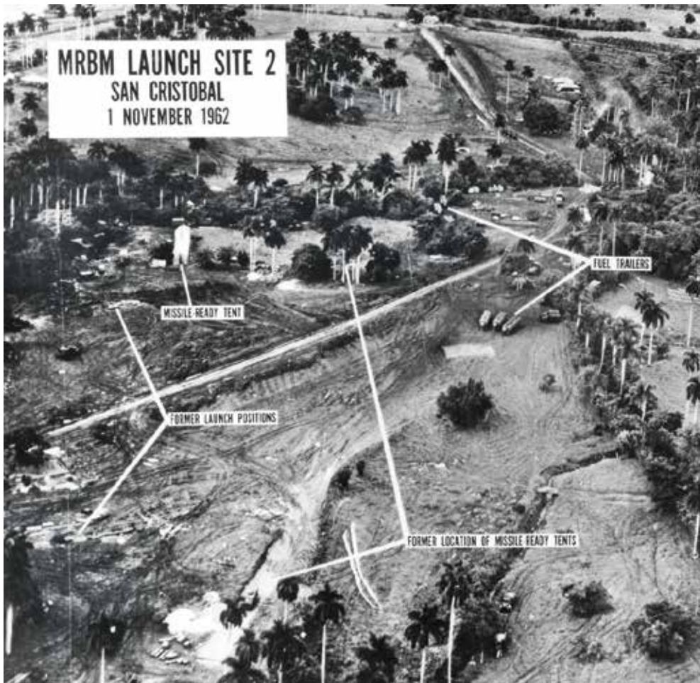
משבר הטילים בין ארצות הברית לברית המועצות, 1962. את ההסכמות שהביאו לפתרון המשבר אפשר לייחס להרתעה ההדדית בין שתי המעצמות.

לפעול מול טרור". 18 יש כמה סיבות לטענה שמהות ההרתעה אינה רלוונטית במקרה של איומי טרור. הראשונה, טרוריסטים אינם נחשבים רציונליים. השנייה, הטרוריסטים נחושים להשיג את מטרתם כמעט בכל מחיר. השלישית, הם אינם פוחדים מתגובה למעשיהם. 19 חוקרים אחרים (מעטים יחסית) טוענים שבמקרים מסוימים התרעה יכולה לגרום לקבוצות טרור להימנע מפעולה. ואולם גם לפי גישה זו מדובר בטענה בעייתית משום שברבים מהמקרים של ארגוני טרור, קשה להרתיעם לאורך זמן. 20 כשארצות הברית בחנה את כוונות אל-קאעדה לתקוף בתוך שטחה, לאחר המתקפות המוצלחות של ארגון הטרור על שגרירויותיה בניירובי (קניה) ובדאר א-סלאם (טנזניה) ב-1998, ובהמשך במתקפה הימית על המשחתת "קול" (ב-2000) - קהילת המודיעין האמריקנית לא חשבה