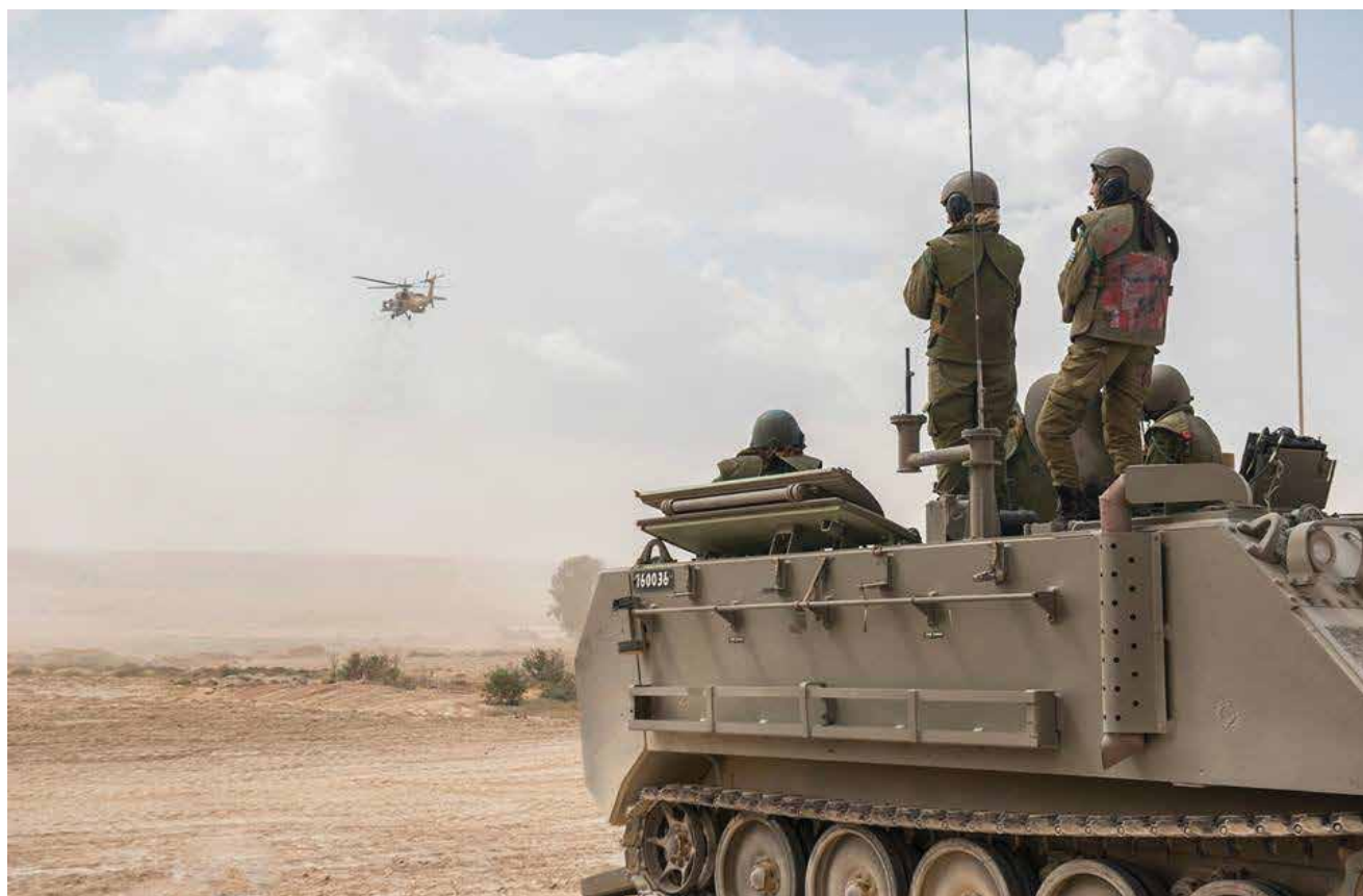
לוחמים בתרגול לחימה רב-זרועית. העיסוק בִּשְׁם הגישה עלול להסיט את ההתמקדות מהעיקר, והוא השינוי הנדרש

צה"ל נדרש לאמץ את "פיקוד משימה" כפילוסופיית הפיקוד הבלעדית, ועדיף לכנות אותה בפשטות "פיקוד". יש להיפרד ממתן הלגיטימציה לגישות פיקוד לא רלוונטיות בשדה הקרב, כמו "פיקוד פרטני", ובאמצעות לימוד הפילוסופיה הזאת והכלים המעשיים שהיא מציעה נכשיר את כלל המפקדים