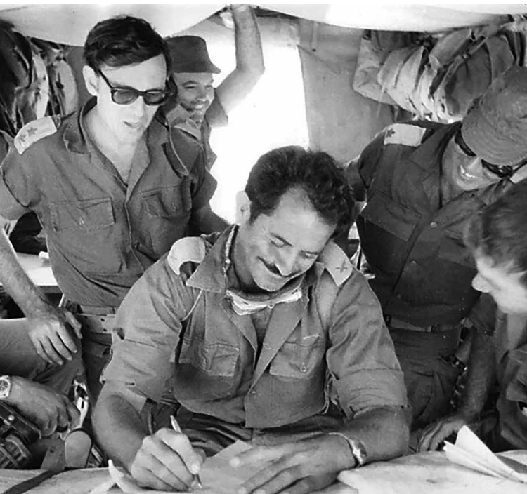
חפ"ק מאו"ג 146, אלוף מוסה פלד במרכז. אוקטובר 1973. פעמים רבות נוצר בשיח בלבול בין "פיקוד פרטני" ובין "שליטה ריכוזית"

הוא רוצה שיקרה, מה הוא לא רוצה שיקרה, לאן הוא רוצה להגיע, מהם האילוצים ההכרחיים ומדוע.