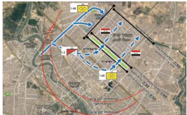
מרחם קרב צדד סיטי. הוחלט לצאת לשלב שיוקרא "חומת הזהב", שלמעשה יחסום פיזית את הסתננות האויב למרחב ויגביל את חופש התנועה שלו

כמעבר ללחימה בעצימות גבוהה הכוחות עברו משימוש כרכבים קלים לרכבים קרביים משוריינים כמו בראדלי וטנקי אברמס,