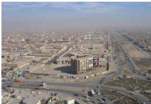
צדר סיטי. מדריך השדה מכווין לכך שבלחימה נגד התקוממות על הכוחות לשלב פעולות צבאיות ואזרחיות

גופי המאבק נגד התקוממות חייבים להבין את הסביבה. הבנת הסביבה היא חיונית להבנת האיום והמודיעין. ללא הבנה של התרבות, המניעים והמתחים בין הקבוצות, לא ניתן יהיה להפיק את המודיעין שנאסף או ליישם פעולות בהתאם. 25 דוגמה לכך ניתן ללמוד מהגברת פעולות השיקום האינטנסיבי שהביא גם גיוס סוכנים מקרב האוכלוסייה