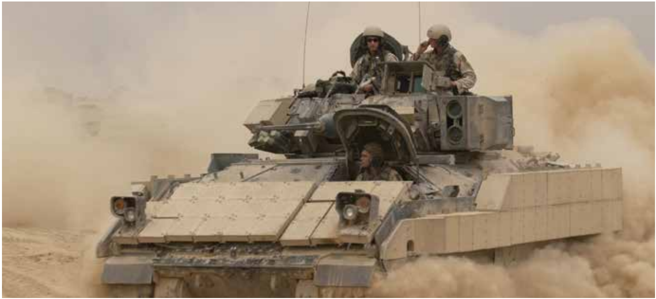
גנ"ש אמריקני M2 בראדלי בעיראק. במעבר ללחימה בעצימות גבוהה הכוחות עברו לרכבים קרביים משוריינים כמו בראדלי, שהושארו עד כה בבסיסים עורפיים

להסלמה. לקח לכוחות זמן רב לעבור למצב של לחימה כזו, מכיוון שהם השאירו את הכלים שלהם בבסיס עורפי. תוכנה זו ברורה לצה"ל, על אף שלעיתים מנסים להכניס כלים לא ממוגנים כמו סבלי חי"ר. צה"ל ללא ספק מתעצם בכלים משוריינים לכוחות החי"ר, שיסייעו לו בלחימה בשטח בנוי וצפוף הרווי במטענים. ז. הקרב בצדר סיטי הביא לשיפור כשירות הכוחות העיראקיים, וסייע למטרת העל של האמריקנים – להשאיר מדינה בעלת צבא שמסוגל לשלוט במדינה באופן עצמאי. לפי עקרונות אלה, בלחימה הבאה בעזה נכון יהיה לחשוב על הכנסת כוחות של פלסטינים להילחם, אם נרצה שגורלם יהיה בידם. דבר זה יביא להגברת הלגיטימיות של המשטר. ניתן לראות דוגמה לפעולה מסוג זה באזור יהודה ושומרון, במקום שבו הכוחות הפלסטינים שולטים בו ויש שיתוף פעולה עם הכוחות של צה"ל. מובן שזהו מצב אידיאלי שיהיה קשה לממש.