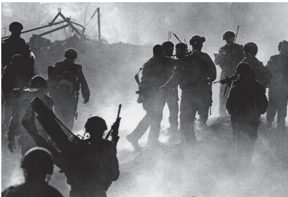
לוחמים של צה"ל במלחמת לבנון השנייה | במרוץ המטורף לקידום מעטים הם הקצינים הנשארים בתפקידיהם די זמן שיאפשר להם לראות את תוצאות פעולותיהם ולהימדד לפיהן

הקצינים שיצאו מצה"ל לעמדות בכירות בתחום האזרחי והפכו (או לפחות אמורים להיות) דוגמה לחיקוי ובעצמם משתתפים ביצירת אותה אווירה כללית שלכאורה יצרה את "הראש הקטן".