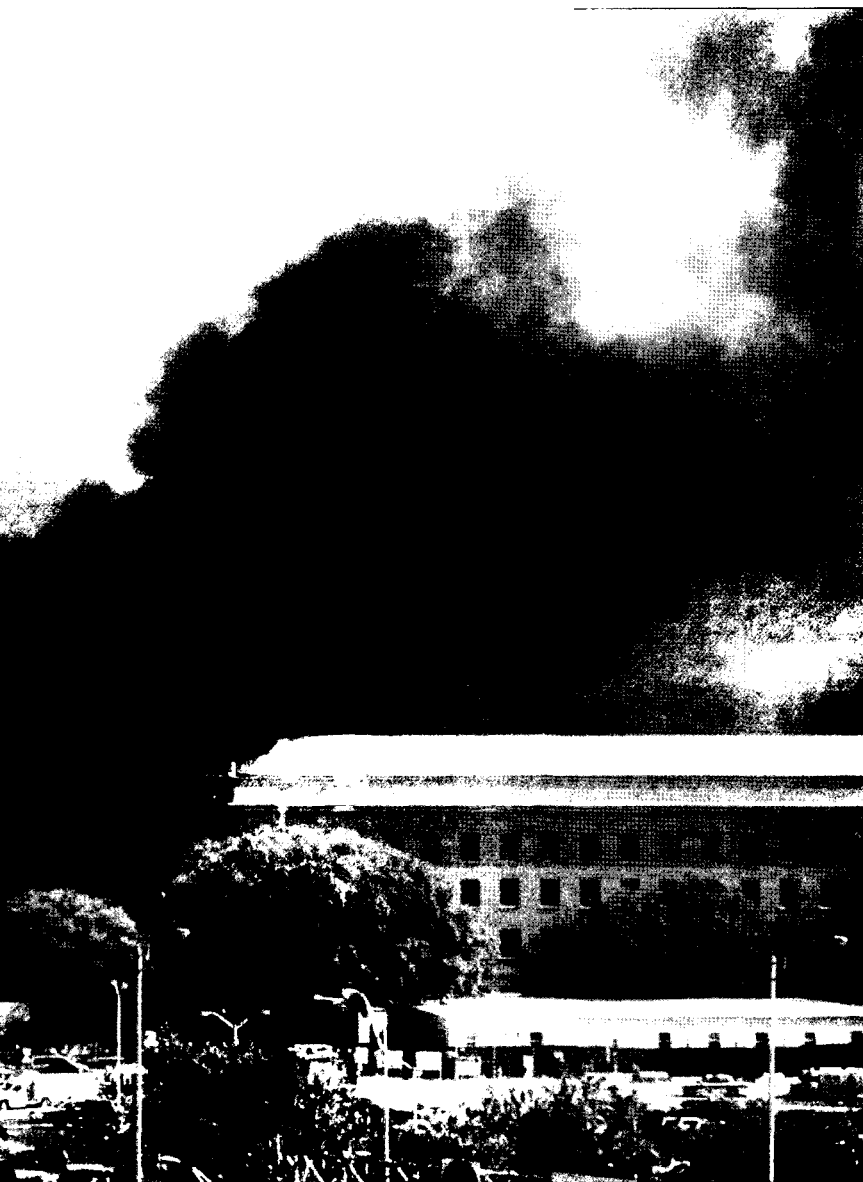
ארה"ב, אזרחיה וחיליה מהווים מטרה לטרור האסלאמי זה שנים רבות

לוחמה נגד גרילה וביצועה דורשים גוף מודיעין ייחודי, שיהיה חלק בלתי נפרד מכוח המשימה. מתכנני מבצעים זקוקים לכל מקורות המודיעין, לרבות מקורות חיצוניים. כוח אווירי דורש מודיעין בזמן אמת, מכיוון שהמיידיות של