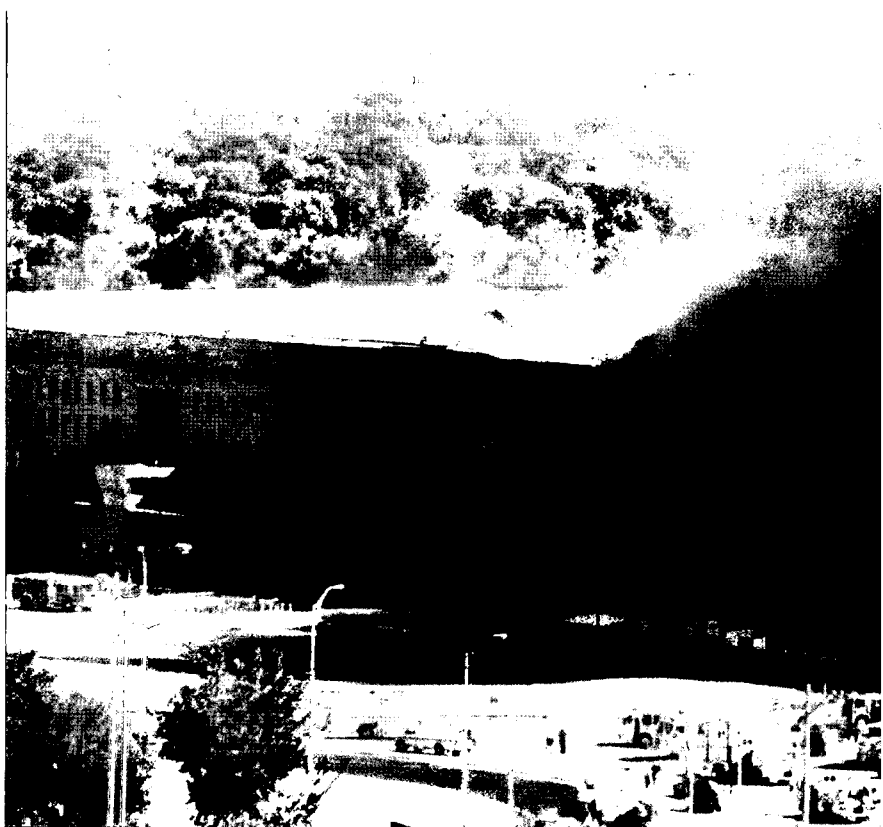
לאחר מלחמת המפרץ הפכו למטרה אטרקטיבית בדומה למטרות ישראליות

מודיעין, שנבנו לקראת מלחמה כוללת, לא תמיד מתאימים לעימות מוגבל וללוחמה נגד גרילה. למבנה הארגוני, שבו המודיעין כפוף למפקד כוח המשימה, עשויה להיות חשיבות מכרעת, מכיוון שדרוש שיתוף פעולה הדוק מאוד בין המודיעין לבין הכוח המבצע. הכפיפות חיונית משום ש"מחזור החיים" של המטרות מהרגע שהתגלו ועד שהן