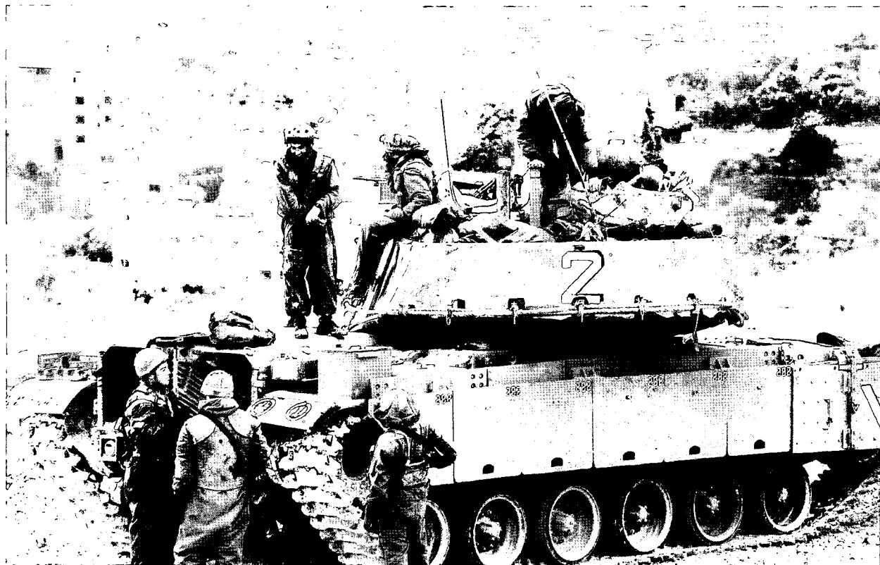
טנק של צה"ל - בפאתי יישוב פלסטיני

מגוונות. אנחנו משתמשים בקשת רחבה מאוד של שיטות ואמצעים. לא הכול חשוף לציבור, וטוב שכך. צריך לזכור שזו מערכה מאוד מורכבת - גם במישור המדיני, גם במישור הצבאי, גם במישור התודעתי, גם במישור הפסיכולוגי, גם במישור הכלכלי וגם במישור התקשורתי". 1