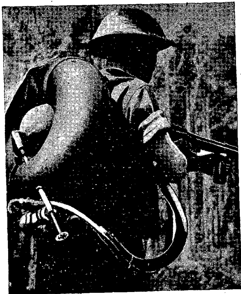
זרקאש בריטי — גלגל-ההצלה. במרכזו — מיכל-הגז הדחוס. הקנה דומה ל"קרביין" תת-מקלעי.

בקרבנות נורמנדיה, בפעולות נגד נקודות בצורות ותיבות-שרדה למיניהן, בכיעור האויב מישובים ומשטחי-יער, מילאו זרקיההאש החדשים שהוכנסו לשימוש בצבא הבריטי והקנדי זמן קצר לפני הפלישה לצרפת תפקיד ניכר; כן רב היה השימוש בזין-אש בקרבנות עמדות ובתיגרות-המנע לאורך-קו זינפריד, ליד מצודותיה של מזן ובאיי-הנהר של הולנד.