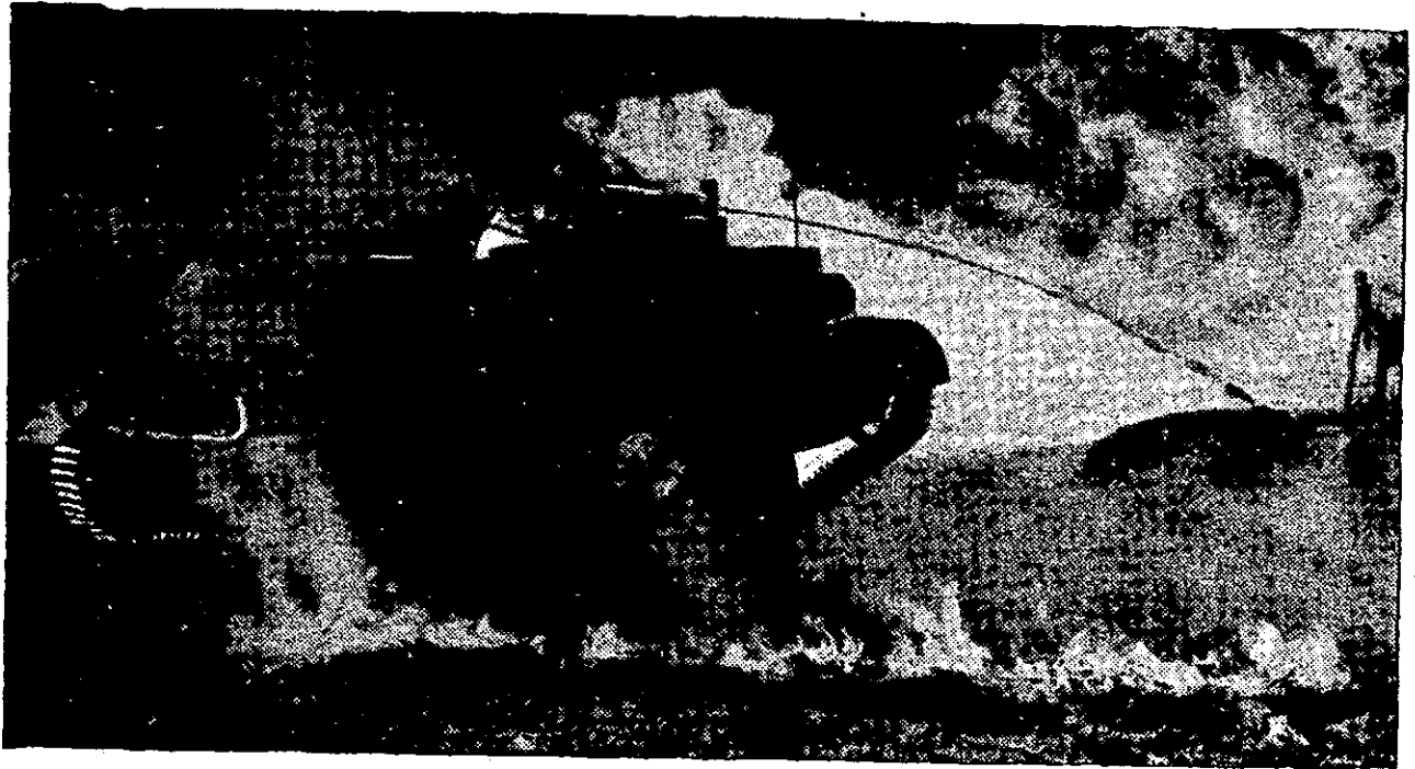
ה"דבור" — זרקאש בריטי מותקן ברכב-שריון קל מסוג "נושא-הברן". המיכלים — על חלקו האחורי של כלי-הרכב.