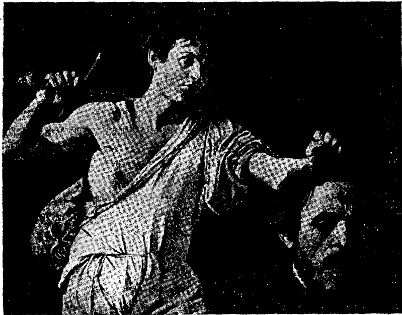
דוד עם ראשו הכרות של גלית — ציור של מיכלאנג'לו פאראבאזי

כמו במקרה של דוד וגלית תהיה ההכרעה לטובתו של בעל הסכין אשר ידע לשלחו כך, שיפגע בבעל הפטיש במקום תורפה כזה, שכל משקלו יהיה, למעשה, חסר ערך ומשמעות. עצם העובדה שיתכן שסכין יכריע את הפטיש דיה להורות שישנה דרך גם לבצע זאת. צריך לחפשה. אין כל הכרח בפטיש דוקא, כדי לנצח במערכה אויב שבידו פטיש. ההיסטוריה מלאה דוג"מאות כיצד ניצח "דוד" את "גלית" במקומות אחרים, בתנאים אחרים ובתקופות שונות.