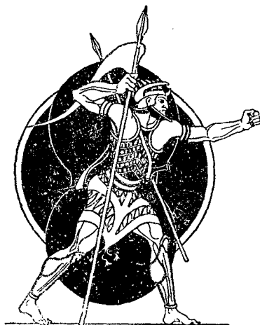
שחזור דמות גלית, לפי גרסטנג

פרשת דוד וגלית (שמואל א' י"ז, 4—54) מפי תיעה ביותר ומעוררת סקרנות ומחשבה. הרביתי לקראה וחיפשתי דרך להבינה, עד אשר בא ספרו של גנרל ג. פ. פולר ופתח את הפתח אשר דרכו אפשר לנסות לראות באור צבאי מה באמת קרה, למה קרה כך, ולמה לא יכול היה לקרות אחרת. יתכן ונוכל אף אנו ללמוד מפרשה זו לקח. אחרי היסוסים רבים אני מנסה להעלות מחשבותי בכתב. היסוסים — למה? כי לא מצאתי בין חברי אותה הדבקות בספר הספרים אשר מצאתי בצבא אחר בו שירתי. יתכן ודברי יסייעו למחפשי „הנוסחה“, מחפשי הדבר הנק־