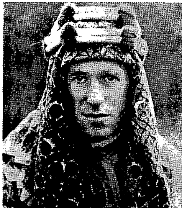
ת.א. לורנס „איש ערב“

אולם בינתיים ניטשה במזרח-הרחוק מלחמת-גרילה נרחבת וממושכת יותר. מלחמה זו התנהלה, מאז שנות ה-20 של המאה, על-ידי הקומוניסטים הסיניים, שבהנהגתם מילא מאו-טצ'אטונג תפקיד מכריע יותר ויותר. מלחמה זו התפתחה