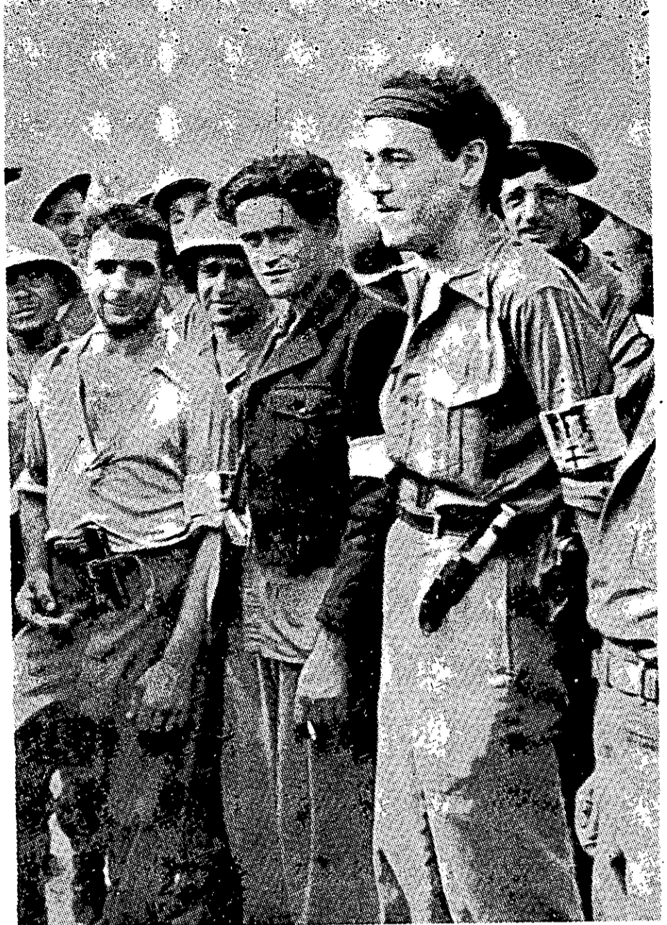
מפגש בין חיילים אמריקניים ובין לוחמים מה"מאק" הצרפתי

ברם, כאשר מנתחים מסעי-מלחמה אלה באזורי-העורף, נראה כי השפעתם עמדה במידה מרובה ביחס ישיר לשיעור שבו היו משולבים עם מבצעיו של צבא-סדיר חזק, שהיה אוסר קרב על חזיתו של האויב ומושך לשם את עתודותיו. ולעתים רחוקות היו כוחות-הגריליה ליותר מאשר מטרד — וזאת רק כאשר הזדמנה פעולתם, בעת-אחת, עם העובדה — או עם האיום הממשמש-שׁובא — של מתקפה רבת-עצמה, שתבעה את תשומת-לבו העיקרית של האויב.