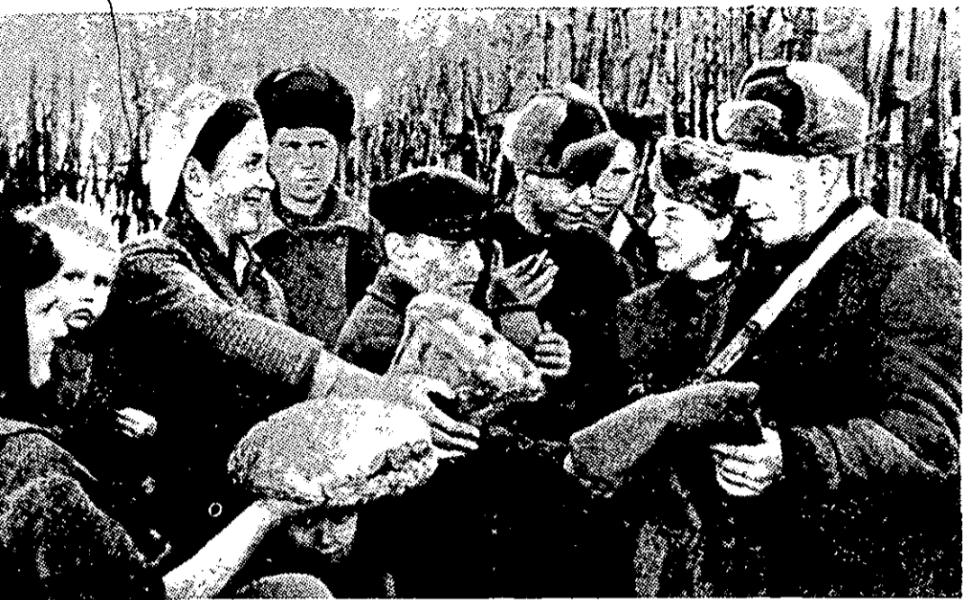
הפרטיזנים הרוסיים נהנו מאהדת האוכלוסייה

נכנסנו לעידן-אסטרטגיה חדש השונה שוני רב מכל ששיערו אלה שטענו לזכותה של עצמה-אירית-אטומית — הלא הם מהפכני העידן שחלף. האסטרטגיה אותה מפתחים עתה יריבינו שואבת השראתה מהרעיון הכפול של חמיקה מפני עצמה-אירית עדיפה, ושל העמדתה במצבים של חוסר-אונים. אכן, יש בכך משום אירור ניה, שככל שפיתחנו יותר את מחץ-פעילותו, המאסיבי של נשק ההפצצה-הגרעינית — כן סייענו יותר לקידומה של אסטרטגיה חד-שה זו נוסח גריליה.