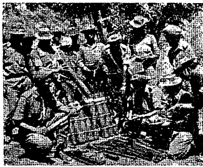
שלל של תחמושת פכיסתאנית

מכוסים בקנה-סוכר ובעשב בגובה של 2.5-2 מ', ובתוכם נעו ה"פאטונים", בעלי הצללית הנמוכה, כסומים בארובה. "אנשי חי"ר הו" דיים התגנבו אל הטנקים הפכיסתאניים דרך הצמחיה הסבוכה והצליחו להתקרב אליהם עד לטנח הדרוש לשם הפעלה יעילה של התול"ר בן 106 המ"מ". תפקיד חילות-האוויר של שני הצדדים היה לספק סיוע מרום נמוך לכוחות הקרקע שלהם. המטוסים הפכיסתאניים החדשים והמהירים יותר - סילוני "סייבר F-86", ו"סטארפיטר F-104 C" - הוכיחו עצ-מם כבלתי מתאימים למטרה זו.