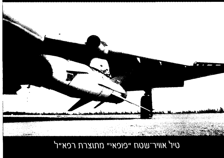
טייל אוויר-שטח "סופאי" מתוצרת רפאל

יש לכלול את ההתבססות המלאה על טכנולוגיות מתקדמות - בחלקן ייחודיות - ברשימת הממדים של האסטרטגיה רבתי בגלל החשיבות הקריטית של הנושא לעליונות הביטחונית הישראלית לטווח הארוך