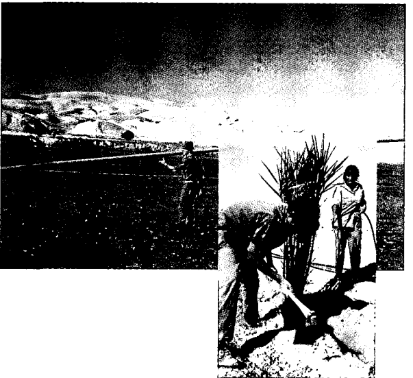
היאחזות נח"ל אלישע שבכקעת הירדן

תמהיל דינמי וגם "קפיצתי" בין הסדרים ושלוש מצד אחד לבין מלחמות ומגוון של מעשי אלימות והתנגשויות מצד אחר, כלומר, בוודאות כמעט דטרמיניסטית ניתן לומר שלפחות ב-50 השנים הקרובות נהיה במצב של "בין שלום למלחמה".