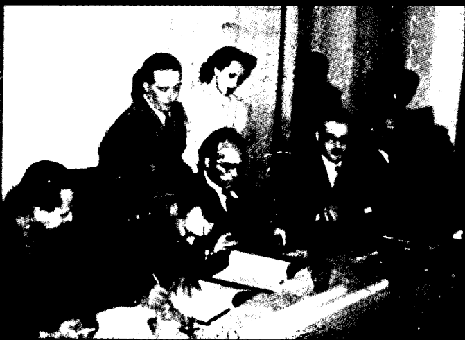
חתימת הסכמי שביתת הנשק ברודוס, 1949

על ישראל להקיף שלא לחתום על הסכמים ועל "בריתות", שיש בהם כדי להגביל מאוד את חופש הפעולה שלה, אלא אם כן התמורה שאנו מקבלים היא גבוהה מאוד, וגם אז דרוש לשמור על גרעין של חופש פעולה, בלי שיהיה בכך משום הפרה בוטה של התחייבויות שישראל לקחה על עצמה