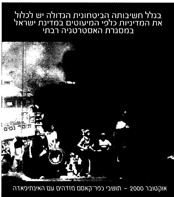
אוקטובר 2000 - תושבי כפר-קאסם מזדהים עם האינתיפאדה

על ישראל לחזק את מעמדה הבינלאומי - בין היתר באמצעות הגברת תרומתה לפתרון בעיות כלל-עולמיות. לכך השלכות רבות, למשל ביחס לעמדות שנוקטת ישראל בדיונים באומות המאוחדות בסוגיות עולמיות. בממד זה נועד תפקיד חשוב לפעולה משולבת עם העם יהודי, 20 תוך הגברת