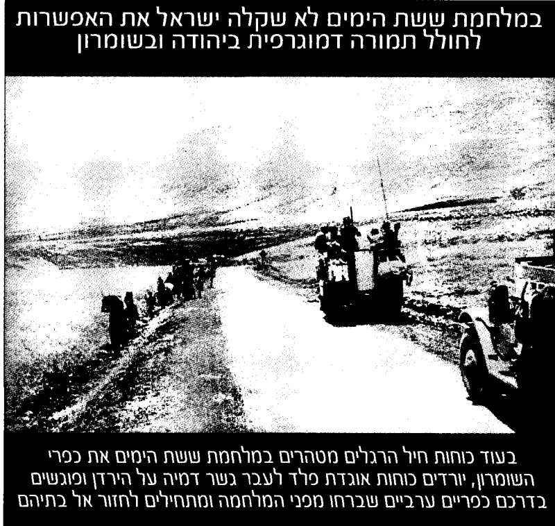
במלחמת ששת הימים לא שקלה את האפשרות לחולל תמורה דמוגרפית ביהודה ובשומרון

שעשינו בעבר מביא בדרך כלל לתוצאות שונות מאלה שהשיגה אותה עשייה בעבר. שנית, אין יסוד להנחה כאילו "הזמן פועל לטוב" – תנו". אומנם גם אין יסוד להנחה ההפוכה, ש"הזמן פועל לרע" – תנו", אולם בהעדר ביטחון שהזמן פועל לטובתנו, מחייבת הזהירות שלא לסמוך על תהליכים בלתי ודאיים ולנקוט במ"קום זאת מדיניות פעילה של "התערבות יזומה בהיסטוריה", הבאה למנוע את הרע, לקרב את הטוב ולהיערך בצורה משורפרת לקראת הבלתי