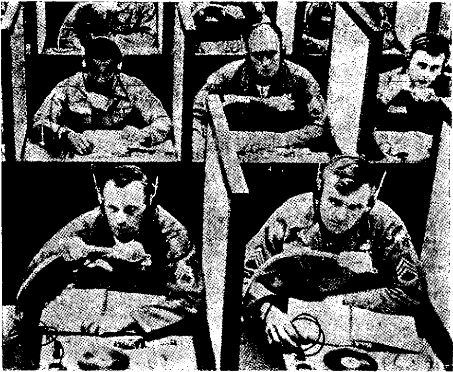
לימוד שפות הנו חלק מתכנית האי-מונים של לוחמי הכוחות המיוחדים

ההנהגה הם הציבור הדתי, או המעמד החברתי, אותו היא מייצגת. המאפיין את שליטתה של הנהגה כזו הוא, בדרך-כלל, הקושי בו היא נתקלת בשליטתה על הכוחות הלוחמים בפועל ובהפעלתם המבצעית; תכופות שולטת היא בכוחות אלה רק על-ידי מתן הכונה אידיאולוגית כללית.