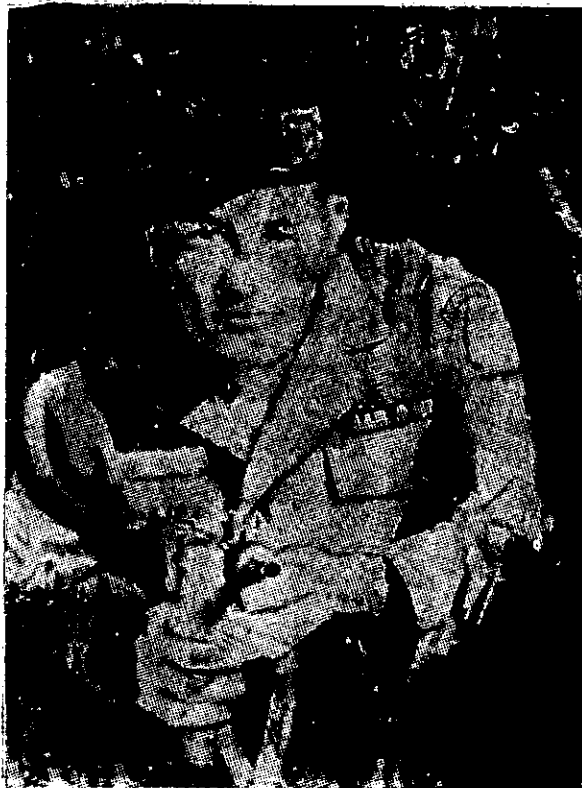
חיילי הכוחות המיוחדים לומדים להפעיל סוגי נשק רבים נוסף על הנשק התקני של צבא ארה"ב. החייל הזה מחזיק בתת-מקלע עוזי.

היבשה של ארה"ב. מאז פועלים כוחות אלו בדרום-מזרח אסיה, וכן באזורים פחות ידועים, בחבלי-עולם שונים. כיום זהו הכוח הצבאי הסדיר היחיד של ארה"ב הצובר נסיון-קרב, בתנאי לחימה מגוונים למדי, אף בתקופת שלום.