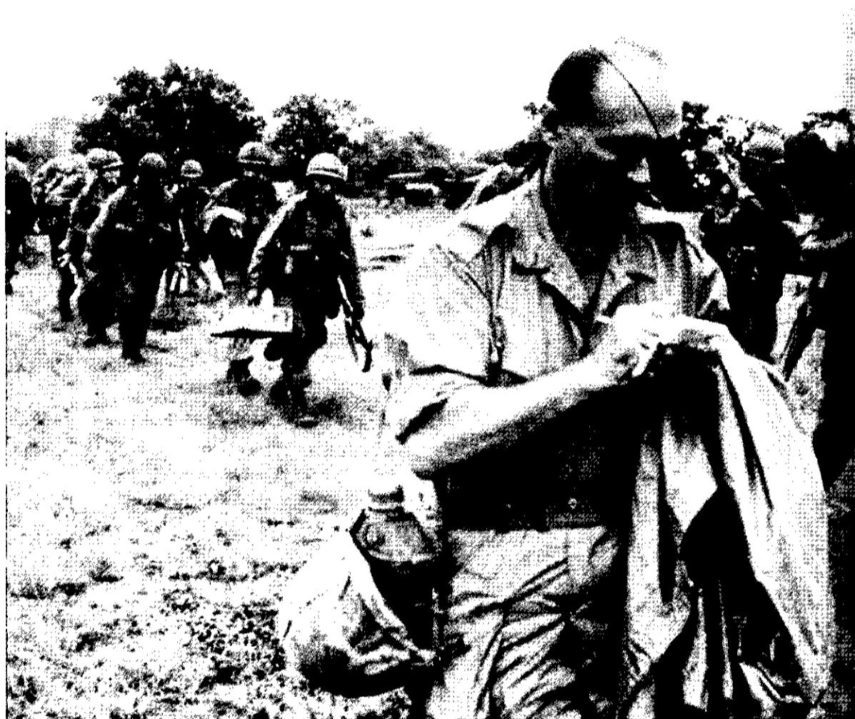
משה דיין הבין כמעט מייד כי הווייטקונג היה כוח סדיר שלחם כגרילה

פירושה אצל גיאפ התחפרות והמתנה להתקפות האויב: גיאפ ראה בהתקפות גרילה למטרות הטרדה פעילות הגנתית מובהקת. את פעולות ההטרדה יכולה הגרילה לבצע באמצעות ניצול ניידותה הרבה. ניווד כזה מאפשר להציק לאויב בכל מקום ובמקביל מקשה עליו לאתר את מיקום הכוחות הפוגעים בו. 39