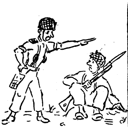
חיילים המחכים שמישהו יגיד להם מה לעשות