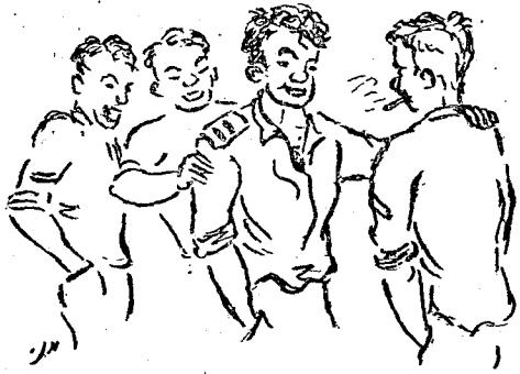
השתורש נהוג של טפיוחות על הכתף

חמש בסמכות ואינם נוטים לקבל אחריות מרצון — ומבכרים להשלים עם עונשים על מקרי התרשלות הבאים עקב נהגם נוהג מעין זה באנשיהם. אולם בזה עדיין לא חם הענין. מתפתחת שיטה של מתן פקודות בצורה של „בקשות“ עם שימת דגש מוגזם על „שכנוע“ — ושוכחים לעתים די קרובות כי יש בצבא הכרח לאלץ אנשים לעשות דברים שעליהם לעשותם. זאת ועוד. במצב כזה מתקשים מפקדים לתת (ויש ואף נמנעים מלתת) לאנשיהם פקודות בלתי-נעימות, פן תפגענה פקודות כאלה בפופולריות הרגעית שלהם; כן נמנעים הם מלגזור באנשיהם על מעשים המחייבים גערה. מתפתחת דרך ניהול-יחידה שאינה דורשת מאנשיו של אותו מפקד אלא ביצוע-מינימום; ועם דרך-ניהול כזו באות שבירת המשמעת, ופגיעה חמורה ב„מוראל“. אך גם בזה טרם נגמר הדבר. במצב כזה ימצאו מפקדים המעבי-רים את האחריות לפקודות לא-נעימות על שכם מפקדם. ונמצא, שבמצב מעין זה סובלים האימונים, משום שאינם אינטנסיביים, כדרוש, ואף אין אופיים אגרסיבי דיו — אלא יותר ויותר הופכים הם מיכ-גיים, כמתנהלים משום „מישהו מלמעלה“ הורה להתאמן.