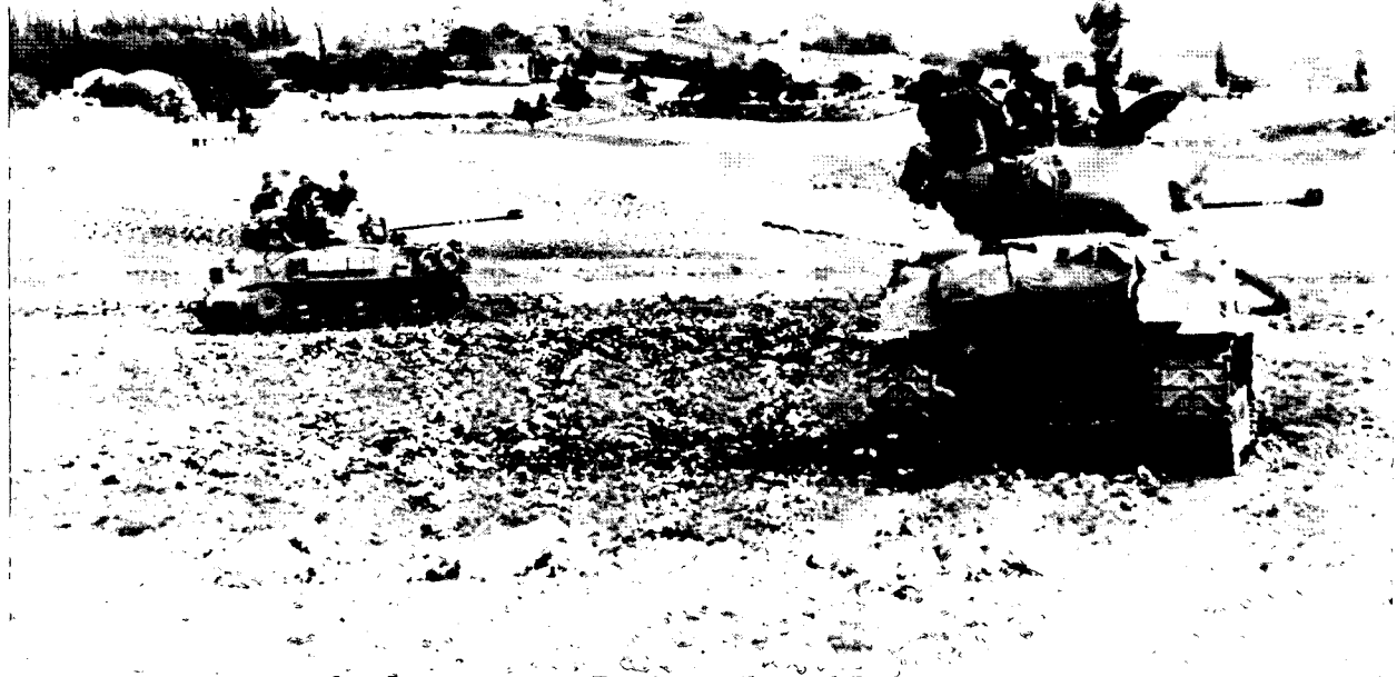
כוח טנקים ישראלי לפני הכפר גינספוט בעת המלחמה