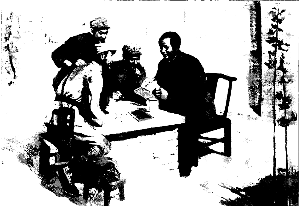
מאוקבע את התמשכותה רבת השנים של המלחמה כעיקרון מלחמה של שיטת גרילה

לפני שלוחמי הארגון ייעלמו שוב. המצב קשה שבעתיים, כאשר לוחמי הארגון אינם תוקפים את כוחות הביטחון, כי אם את אזרחי המדינה, אשר אינם מצוידים ומאומנים להגיב על התקפת הפתע. הגעתם של אנשי הביטחון לעזרת האזרחים המותקפים תהיה תמיד באיחור. הקושי מוגבר עוד יותר, כאשר הארגון מפעיל אמצעי פיגוע בשלט רחוק.