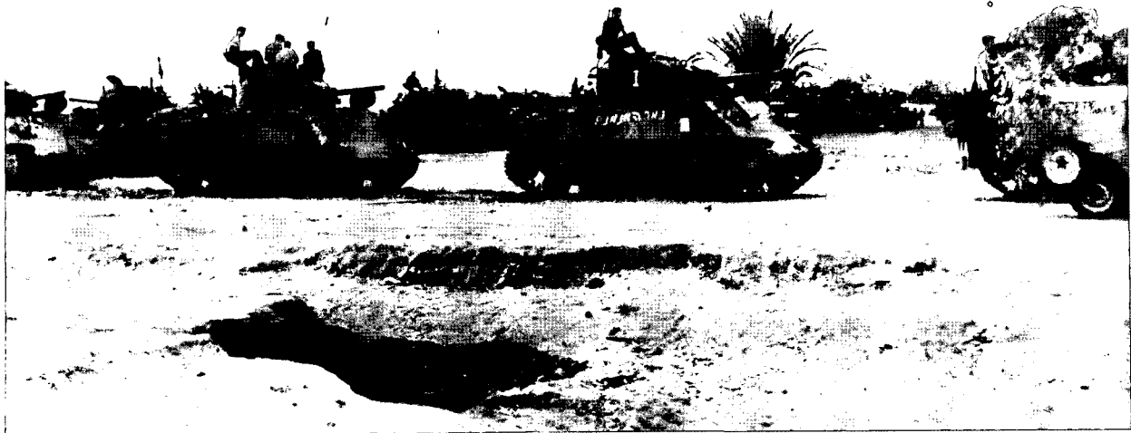
טנקים ישראליים בשטח כינוס במלחמת סיני

במשך מרבית המלחמה, יעדי המלחמה נחשבים לחיוניים - ולעיתים אפילו לקיומיים - עבור הצדדים הלוחמים, קצב האירועים הוא מהיר, ושיעור הנפגעים וההרס הוא גבוה מאוד.