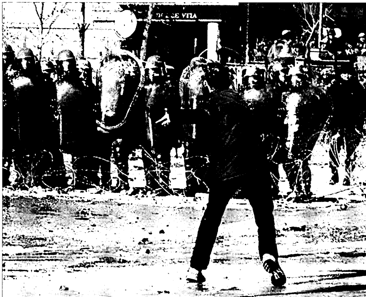
בעימותים מוגבלים נדרשת מהחיילים לעיתים קרובות התאפקות רבה, הדומה יותר להתאפקות הנדרשת משוטרים