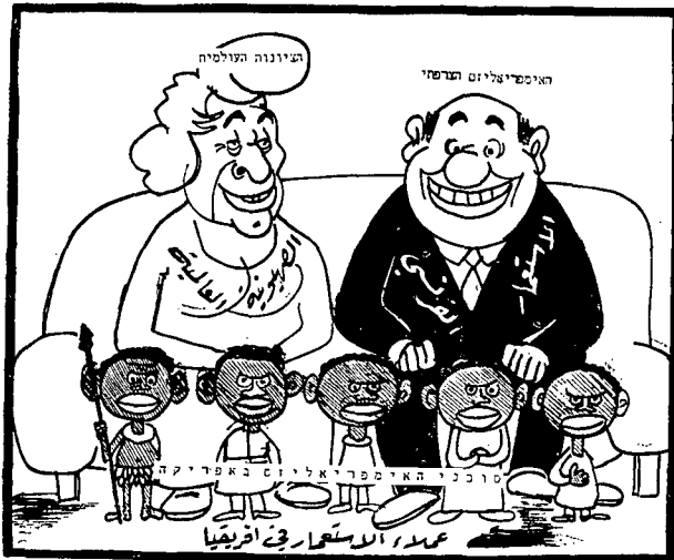
בעקבות עמדת צרפת וסוכניה האפריקאיים בארמ תמונה משפחתית!

ולחדירה לשנקים באפריקה ובאסיה. לבנון התעשרה ושגשגה מאז חדלה ארץ-ישראל לשמש כארץ-מעבר אלטרנטיבית. רבים בין הערבים סבורים שאם יקומו יחסים בין ישראל לבין מדינות ערב, יביא הדבר בעקבותיו להשתלטות ישראל על כלכלתן של המדינות הסמוכות. החשש מפני עצמתה הכלכלית של ישראל מקביל לאי-במעט לחשש מפני עצמתה הצבאית; אולם בעוד העצמה הצבאית של צה"ל מרתיעה את הערבים מיזמה תוקפנית נגדנו, הרי עצמתנו הכלכלית יש בה כדי להרתיעם — חלקם אם לא כולם — מקשירת קשרים עמנו. הגורם הכלכלי מחזק, איפוא, במדינות ערביות את הרצון לקיים את השבר במגע ההדדי. אין הגורם הכלכלי, בפני עצמו, מניע לאסירת מלחמה על ישראל; אך ודאי שהנו מניע להמשך קיום המצב הנוכחי. מבחינה זו מבטא החרם הכלכלי הערבי נגד ישראל לא רק רצון להחניקה, אלא אף אמצעי להתגוננות בפני חדירה כלכלית ישראלית שמפניה חרדים הערבים.