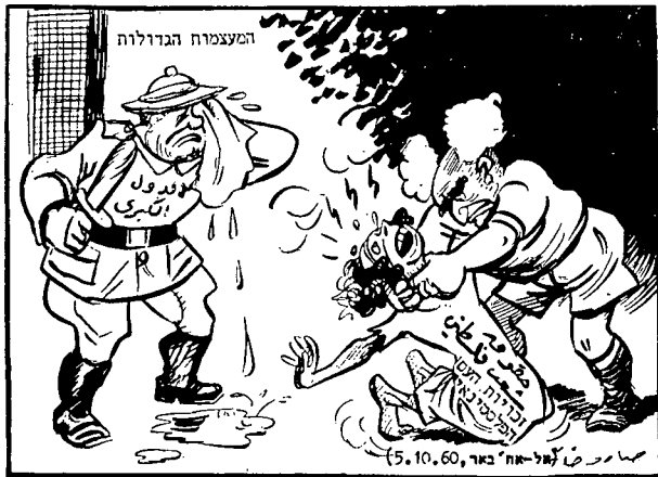
מדיניות "דמעות התנין" המעצמות הגדולות: "לבי נקרע לגזרים בראותי פרא זה החונק את הילדה המסכנה הזו!"

הניגוד כדאי להעמיד לעומתה את דמותו העצמית. כפי שהיא מצטיירת, נאמר, מתוך הקריקטורות של דוש. דומה ששתי דמויות אלה מסמלות את גודל השבר שבין שני העמים. ניתן