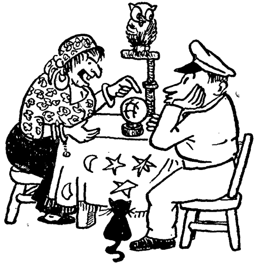
...לחזות ולצפות מראש את ההתרחשויות העתידות

מן-המוסכמות שהמחשבה הצבאית נרקמת ומת-גבשת לאו-דוקא "על פי תקן" או "על פי מסכות" מחשבה מוקצות". היא הנה סך-הכל של פירות המחשבה והתדיינות מאורגנת וחופשית, מעל במות שו-נות, של אלה העוסקים בענין הצבאי ישירות, או אלה שעסקו בו ומוסיפים עתה לתרום חלקם בדיון מעל דפי בטאונים שונים, מטבע הדברים שציבור זה, שהוא נושא המחשבה הצבאית החופשית, מורכב בעיקרו קצינים בפועל או בעבר, בשירות פעיל או במילואים.