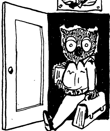
"... כי מאולפן תצא תורה"

שהרעב לסיוע-ארטילרי הוליד את ראיית "חזות-הכל" בארגון הטבלאות לתכניות-אש ובתיאום-תנועה-ואש; כשהכל פנו לעבר קווי-הדיווח, עד כדי זלזול בערך החיפוי-העצמי בכיתה ובמחלקה; ההתפסות למסגרת הערכת-המצב הביאה לפולחן הסעיפים והמחשבה המאורגנת, עד כדי ביטול "חיוב הגיון האויב"; ועוד כהנה וכהנה (איני רואה בכך ידויו אישי, אלא פשוט הכרה בתופעה עובדתית — אשר, כרגיל, ימצ- או ודאי רבים שיטענו שהם נקיים ממנה). בדרך זו הגענו בתקופה אחרונה ל"עידן עבודת-המטה", כש- הכל סוגדים ללוחות-המטה, ומשתדלים לקיים בוקר- וערב מצות-נוהלים ומוסר-אחידות-השגרה.