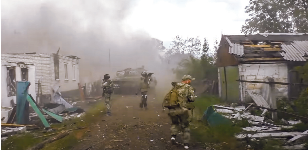
כוחות מרוֹרוֹסִים נעים בחורבות ליסיצ'נסק. נוצרה שחיקה הדדית שהסתיימה בכיבוש העיר על ידי צבא רוסיה.

על ידי איגוף עמוק, ההתקדמות הרוסית האיטית מלמדת על עוצמת הלחימה בין שני הצדדים. ביום הראשון ללחימה החלו הצבא הרוסי וכוחות הרפובליקה של לוגהנסק לנוע לעבר פאתי העיר סוורודונצק והכפרים שסביבה, ובמקביל ניסו לבצע איגוף עמוק. ב־10 במאי ניסו כוחות הצבא הרוסי לחצות את נהר סוורסקי דונץ, ונתקלו במארב אש אוקראיני. המטרה של החצייה הייתה לכתר את הכוחות האוקראיניים בסוורודונצק ובליסיצ'נסק מדרום. ואולם הניסיון נכשל בשל גילוי מוקדם של נקודת החצייה הרוסית. החוקר יגיל הנקין פירט את השתלשלות המארב האוקראיני בנהר על סמך עדות של קצין הנדסה אוקראיני. לדבריו: