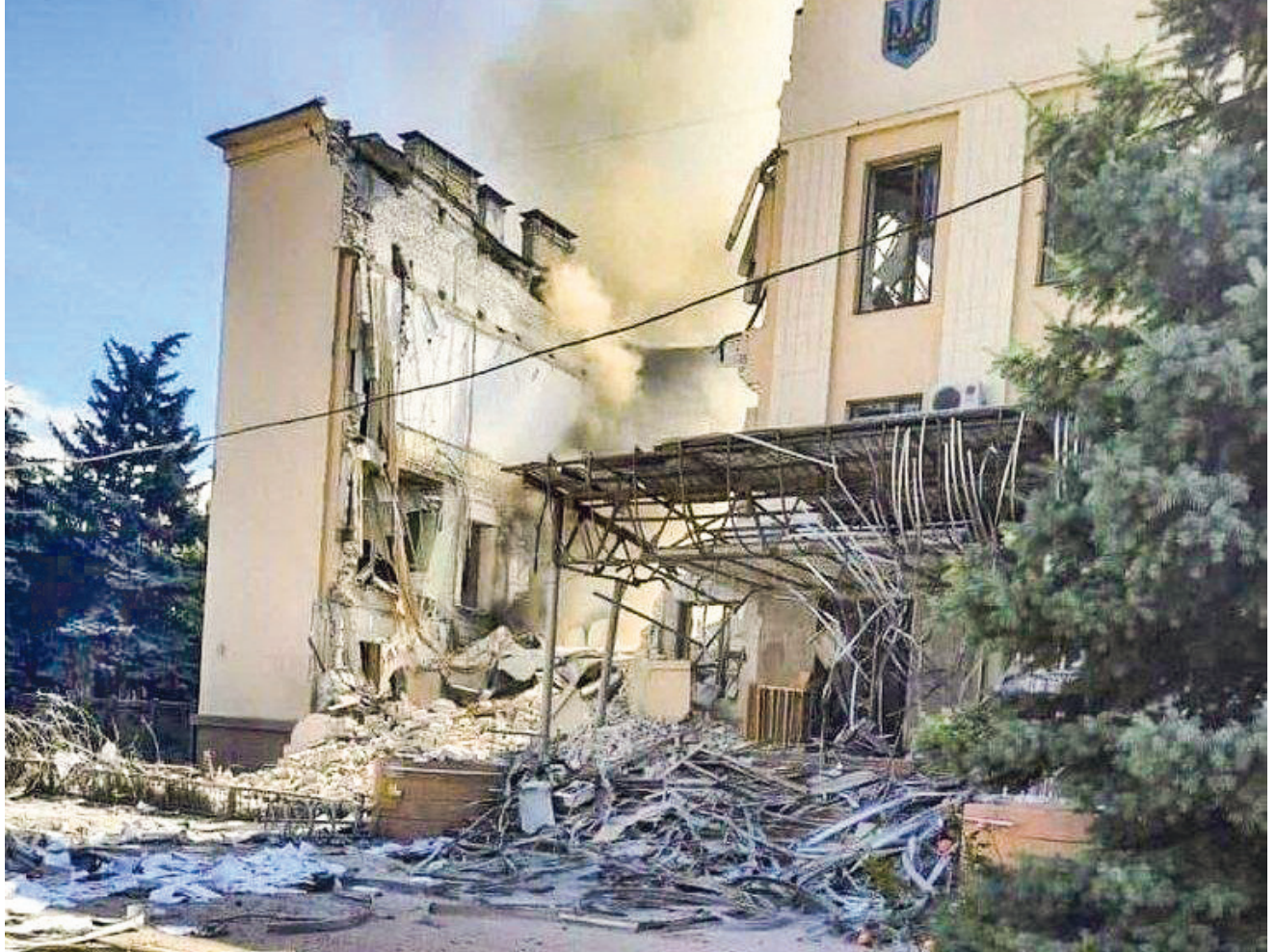
בניין הרוס בליסיצנסק. בשלב מסוים הצליחה רוסיה להשיג עליונות בתחמושת שהובילה לעליונות באש.

נגד. 39 ואולם שיטה זו לא הצליחה למנוע את התקדמות הצבא הרוסי בשל היתרון הרוסי בכוח אדם שניתן להטילו למערכה ללא התחשבות בכמות האבדות. בתחילת מאי 2023 החלה מתקפת הנגד האוקראינית על מרחב בחמוט. המתקפה הגיעה בעיתוי שבו יחסי הצבא הרוסי ומנהל חברת וגנר יבגני פרוגוז'ין היו בשיא המתיחות, בשל טענתו שהוא וכוחותיו אינם מקבלים את התחמושת והציוד שהם זקוקים בקרב על בחמוט. המטרה של מתקפת הנגד הייתה לכתר את הצבא הרוסי שנמצא בתוך העיר, ולהציב בפני המפקדים הרוסיים דילמה בין השמדת הכוח בתוך העיר ובין נסיגה ממנה. מפקד כוחות היבשה של צבא אוקראינה, גנרל אולכסנדר סירסקי, טען שהפריסה הרוסית דומה לקשת ולכן הצבא האוקראיני יכול להשתמש בפריסה זו לטובתו. 40 הרעיון המבצעי האוקראיני לכתר את העיר הסיט את תשומת הלב של שני הצבאות מהלחימה בתוך העיר ללחימה בפריפריה שלה. במהלך מאי החל הצבא האוקראיני לכבוש שטחים שהיו בשליטת צבא רוסיה, כאשר ההתקפה האוקראינית הראשונית כוונה לעבר צפון מזרח. ב־21 במאי כבשו לוחמי וגנר את העיר. 41 ב־5 ביוני החל הצבא האוקראיני מתקפת נגד נוספת, וביומה הראשון הצליח לכבוש בין 200-1,600 מטר. 42 דובר צבא אוקראינה טען שהרוסים נכנסו לתוך "המלכודת של בחמוט", 43 ובמהלך יוני טען שהכוחות האוקראיניים ישחררו את השטחים שהצבא הרוסי כבש באזור בחמוט. 44 במהלך יוני-ספטמבר ערכו שני הצבאות סדרה של התקפות כדי לכבוש את השטח