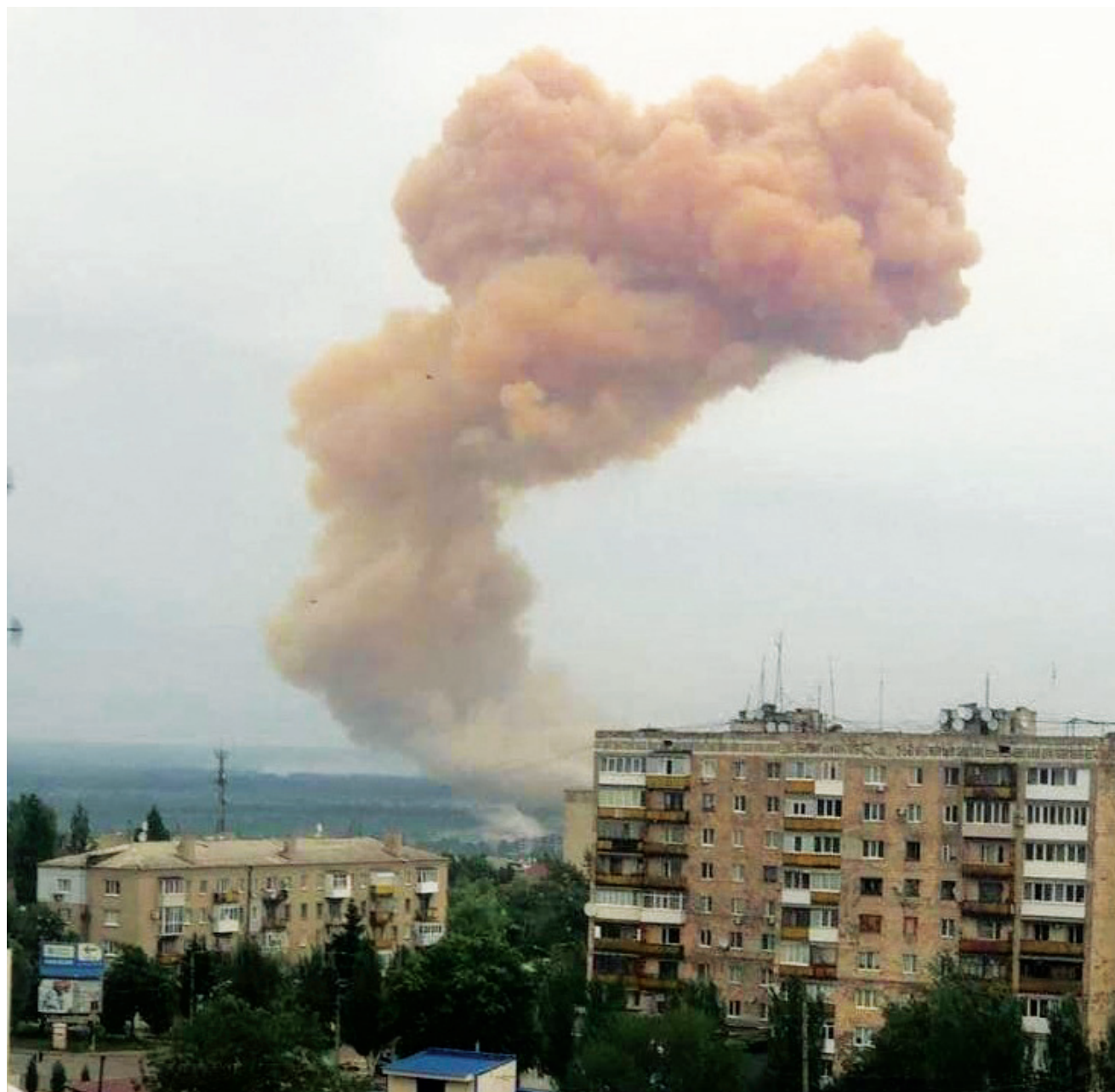
התקפה ארטילרית רוסית על סוורודונצק. ההתקדמות הרוסית האיטית מלמדת על עוצמת הלחימה בין שני הצדדים.

הלחימה בערים אורכת זמן רב מאוד, ודורשת משאבים חומריים ואנושיים גבוהים יותר; שני הצדדים לומדים במהלך הקרבות, אך בשל השחיקה של כוח האדם והמשאבים ושינויים ביעדים האסטרטגיים המדיניים היא מוגבלת בזמן ובמרחב; הלקחים שנלמדו בקרבות ההגנה לא מתאימים דיים לקרבות התקדמות והתקפה. שנתיים למלחמת רוסיה-אוקראינה: על לחימה ששני הצבאות דמיינו, ולא תאמה את המציאות בשטח