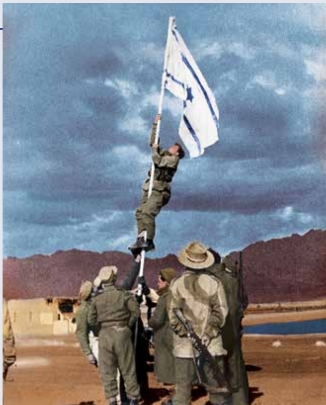
אברהם אדן מניף את דגל הדין באום רשרש

ומנצחים עליהם, שלושת אלפים ושש מאות" (דברי הימים ב, ב:1).