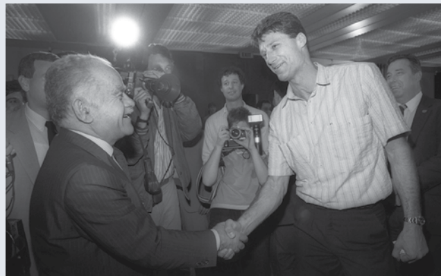
ראש הממשלה יצחק שמיר לוחץ את ידו של מיקי ברקוביץ', בקבלת פנים לכבוד מכבי תל-אביב, 7 באפריל 1987

במגרש הספורט, כמו בשדה הקרב, כל אחד מסמן לו את הדרך שלו לניצחון בהתאם למטרות ולעולם התוכן הרלוונטי לו. בשדה הקרב, מטבע הדברים, מדובר בעניין של חיים ומוות, ולכן התרגשתי לדבר על נושא הניצחון לאחרונה בפני סגל המכללות הצבאיות. אלה המפקדים שילחמו בנחישות, בהתמדה ובמקצועיות, ויכו באויב בזמן הנכון ובמקום הנכון.