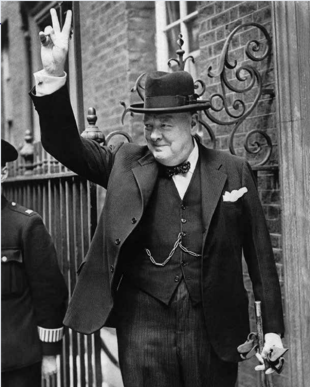
צ'רצ'יל מסמן "V" והופך את מושג הניצחון למוחשי. בזכות נחישותו והחלטותיו בזמן מלחמת העולם השנייה, הוכר כאדריכל הניצחון על גרמניה הנאצית

המתחרים שאפו לנצח בתחרויות, ופירושו המונח "אתלט" היה "מי שנלחם כדי לזכות בפרס". המנצחים זכו לכבוד ולתהילה