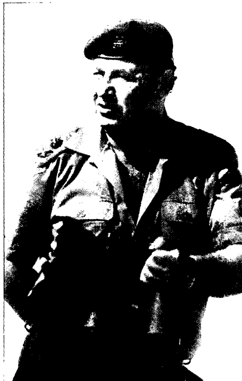
"איתור הלקחים והפקתם דורשים פקודת ביצוע מהרמה הצבאית הגבוהה ביותר, תוך קביעת מסגרת זמן והישגיות"