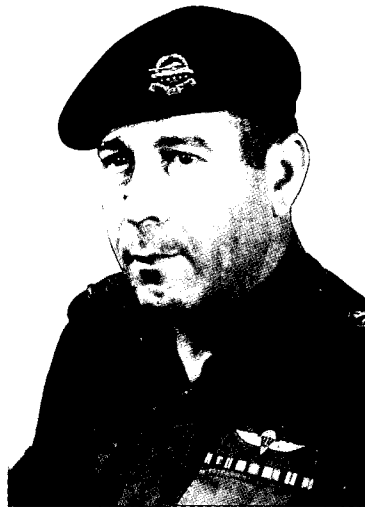
"המטה הכללי והנהלת משרד הביטחון חוסמים כל גישה על אינפורמציה ליום הכיפורים – עד כדי כך שניתן להצביע בעליל על הנזקים שנגרמים"