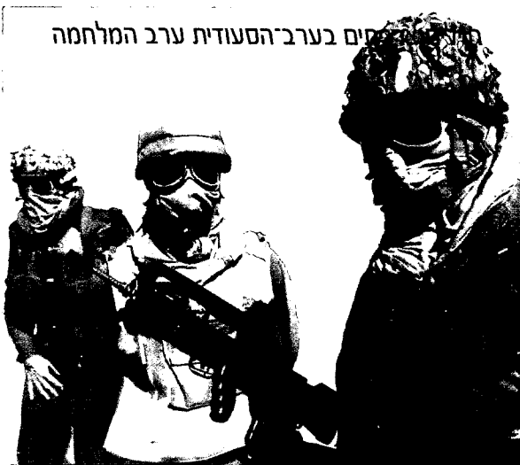
חיסים בערב הסעודית ערב המלחמה

ב-2 באפריל 1990 איים צדאם בפגישה עם קציני צבאו, כי אם תעז ישראל שוב "להכות במפעלי מתכת כלשהם... אני נשבע באלוהים שנשרוף את מחצית ישראל, אם זו תנסה [לעשות משהו] נגד עיראק". 12 היה בדברים גם רמז עמום לחובתה של עיראק לסייע לאחיותיה הערביות, אך אי-אפשר