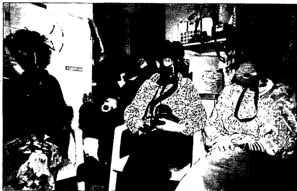
הפתרון שנמצא לכלל האוכלוסייה האזרחית במדינת ישראל היה מקורי וייחודי

שעזבו את ארצם בשלהי שנות ה-70 ובשנות ה-80, עולה כי עוד כשהיה סגן נשיא (1968-1979) הפיץ צדאם את השמועה (הידיעה?) כי עיראק תוחרב, אם המפלגה תאבד שוב את השלטון (ב-1963 תפסה המפלגה את השלטון וכעבור 9 חודשים איבדה אותו).