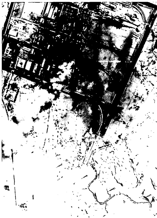
מפעל הפוספטים העיראקי באל-קאים, שעל-פי ההערכות הוסתרו בו משגרי טק"ק - לאחר הפצצתו על-ידי מפציצי B-52

"אם משהו במקום כלשהו על כדור-הארץ - ויהא גודלו אשר יהא - ינסה לתקוף איזשהו ערבי שירצה לקבל את עזרתנו, אנו נגיב נגד התוקפן... אם נוכל, נזרוק אבנים; אם נוכל, נשגר טילים; אם נוכל, נכה בכל טילינו, פצצותינו ובכל יכולותינו... נעשה אותם חולים מאוד... העיראקים יאמרו להם (לאויבים) מתי לנשום" 20 .