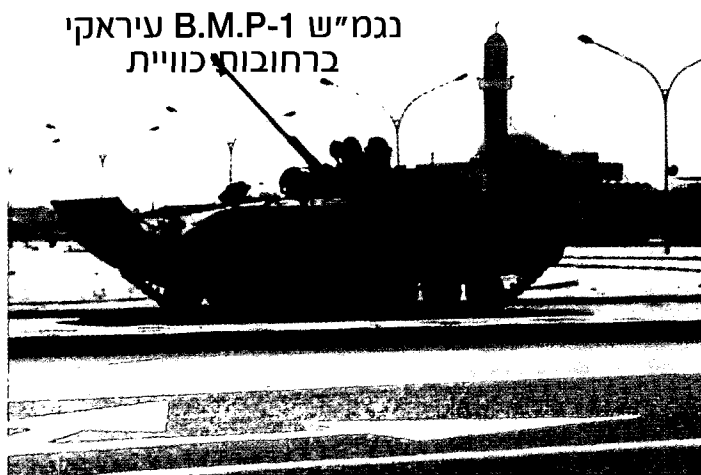
כל עוד היה סיכוי טוב לכך שהאופנסיבה של בעלות הברית תסתיים רק בשחרור כוויית, לא הכול היה אבוד מבחינתו של צדאם חוסיין, ועל כן לא היה גם טעם להשתמש ב"נשק יום הדין" – כימי או ביולוגי

מאות קילומטרים מבגדאד), והם ישוכנעו שהסיבה לכך היא התקפה גרעינית על בגדאד, עליהם לשגר טילים כימיים וביולוגיים לעבר ישראל.