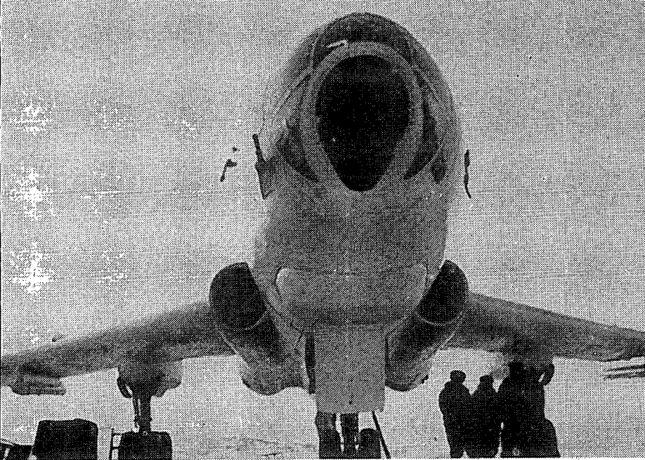
מטוס תובלה סובייטי TU16

למנוע את מעבר המטוסים. הנתיב טביליסי-איראן-בגדאד-דמשק – ללא מעבר בשמי תורכיה (שנעשה בו שימוש במהלך מלחמת יום הכיפורים) – לא בא בחשבון משום אורכו הרב. אולם, מעבר לשיקולי טווח הטיסה, יש לזכור, כי סד"כ מטוסי התובלה הצבאיים בבריית-המועצות בשנת 1956 עמד על עשרות מטוסים בלבד, וספק אם יכלו לשעבד את כולו למבצע כזה. יתר על כן, גם נושא ההנחתה של ציוד מהאוויר היה עדיין בחיתוליו. 54 אמנם, מטוסי נוסעים בעלי טווח מתאים פעלו כבר בשירות בריית-המועצות (TU104ר III18), אך אלה היו בגירסאות אזרחיות בלבד, ולא התאימו להובלת לוחמים על ציודם בהתרעה קצרה.