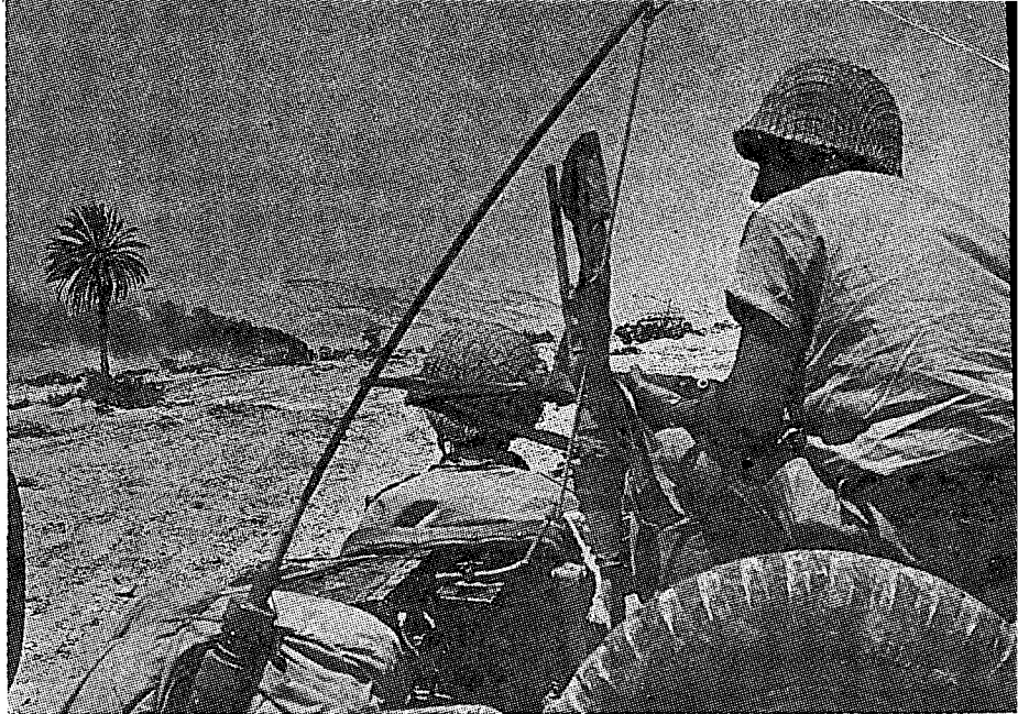
כוחות צה"ל בסני

האמריקנים דאגו לעדכן את ישראל בפרטי האירועים, והשתמשו בהם ללחץ על ישראל לאפשר העברת אספקה לארמיה 3 הנצורה: "... האמריקנים לא יניחו לארמיה 3 שתושמד ... אם לא תקבל אספקה - יעשו זאת