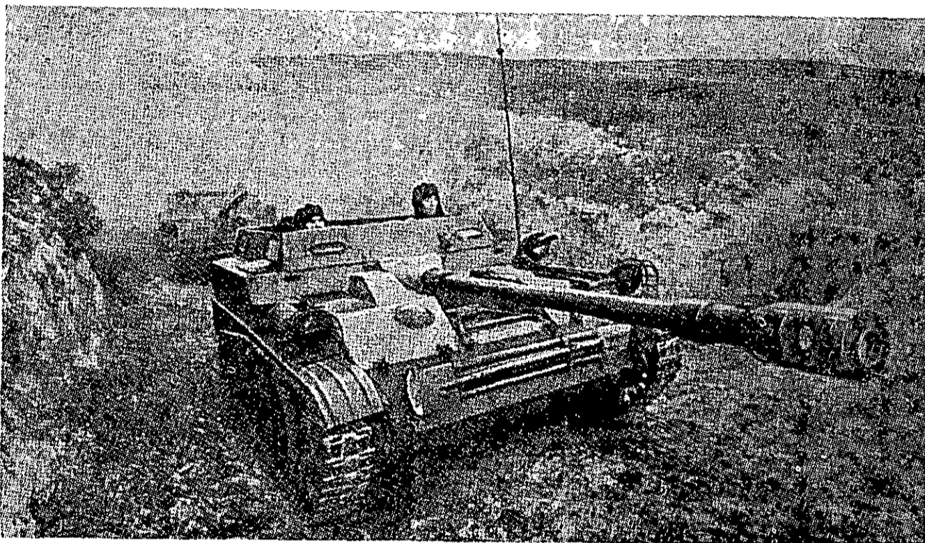
תוחח מתנייע ASU-57

„מחלקה מס' 3, הפועלת במארב, תאפשר לקבוצות קטנות