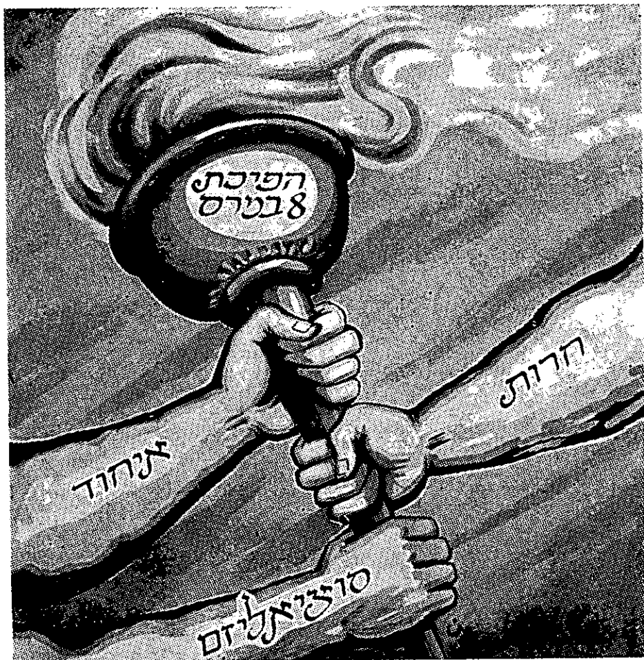
תמונת-שער של בטאון סורי מפארת את הפרכת ה-8 במרס, אשר "באה להגשים את שאיפות-היסוד של הבעת".

● הערבים הם "אומה אחת בעלת שליחות נצחית" של מתן משטר צדק לעולם כולו; הפעולה לאיחודם המעשי היא מצוה ראשונית. איחוד זה יכול להתגשם רק בעזרת המוני העם, המשתחררים מהמורשה הנפסדת של כוחות הפרוד: האימפריאליזם — מבחון, והפרוד המשפחתי, העדתי, הדתי, הסוציאלי והאזורי — מבפנים. כוחות הפרוד מיוצגים על-ידי השכבות השליטות — הפיאודליות והרכושניות. האיחוד מחייב, איפוא, מהפכה כוללת ועמוקה שתסלק שכבות אלה מן השלטון, תעקור מן השורש את גורמי הפרוד המיוצגים