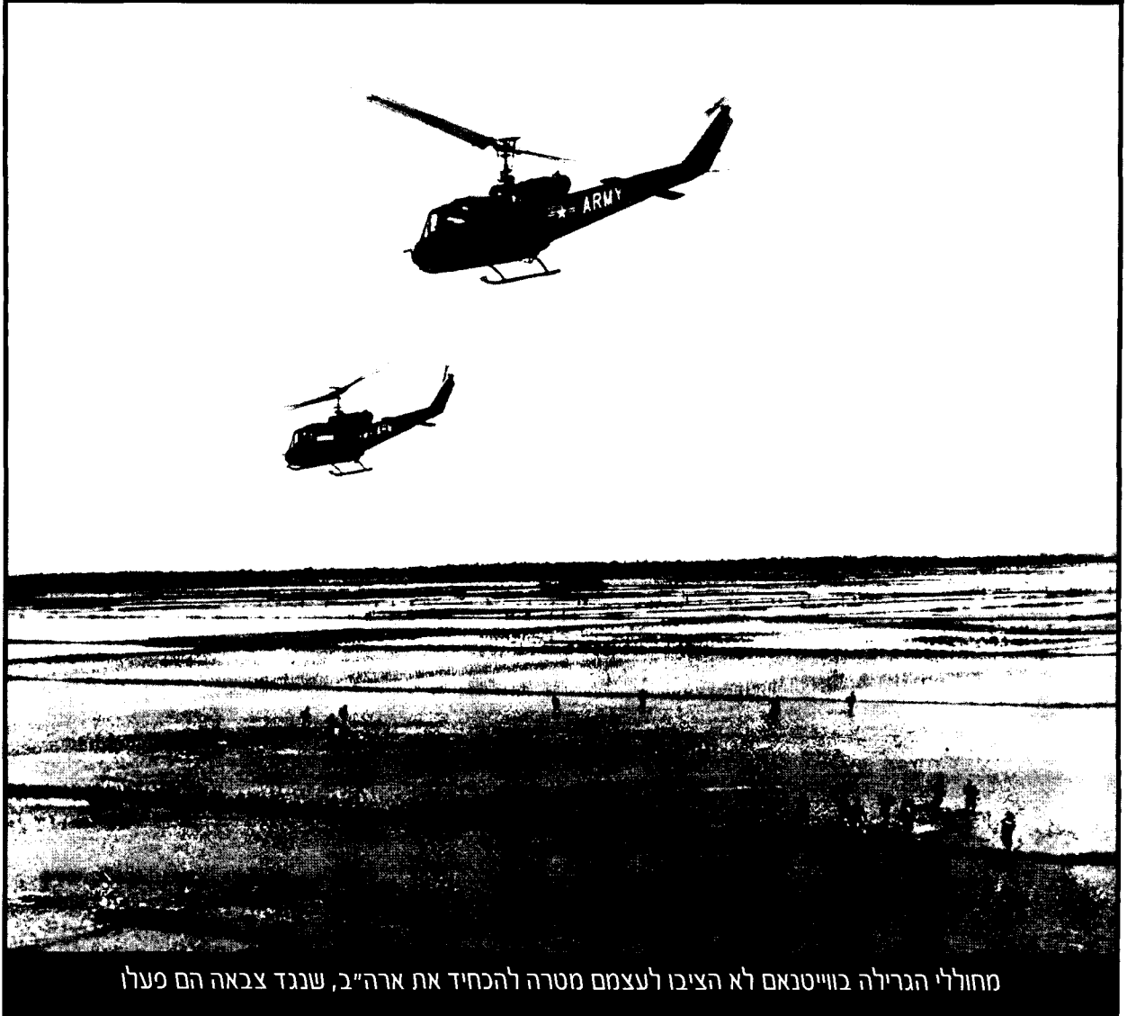
מחוללי הגרילה בווייטנאם לא הציבו לעצמם מטרה להכחיד את ארה"ב, שנגד צבאה הם פעלו

ש"הוגעה" היא מותרות, שגם ארה"ב הגדולה אינה מאפשרת לאזרחיה.