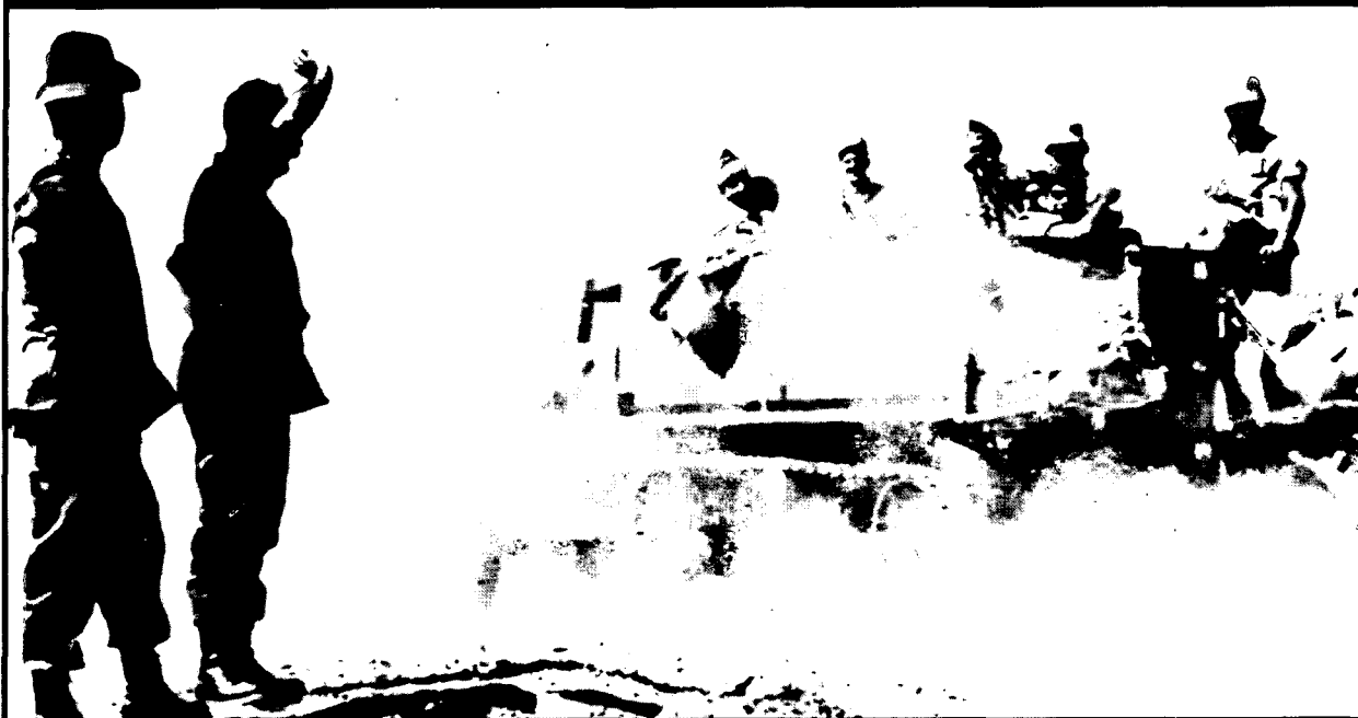
כאשר התברר להנהגה המדינית כי פעולות הגמול אינן מצליחות לעצור את הטרור, הגיעה זו למסקנה הבלתי נמנעת כי יש רק מוצא אחד: הכרעה צבאית מהירה על-ידי כיבוש השטח וחיסול יצרני הטרור ונותני החסות שלהם

בישראל היא ההבחנה שהם נוהגים לעשות אצל הפלסטינים בין ה"פוליטיקאים" ל"אנשי הצבא". כאמור, זהו עוד סוג של פרשנות, המנותקת מעולם המושגים של מושאי הפרשנות, והיא שיצרה אצלנו את המצב שבו הראשונים נהנים מחסינות מפגיעה, מכיוון שאין הם נתפסים כמי שמפעילים נגדנו אלימות. בחינת המבנה והארגון של מחתרות דוגמת אש"ף, שאורגן כבר מראשיתו על-פי התפיסות של ארגוני התנגדות קומוניסטיים, מעלה כי את האלימות