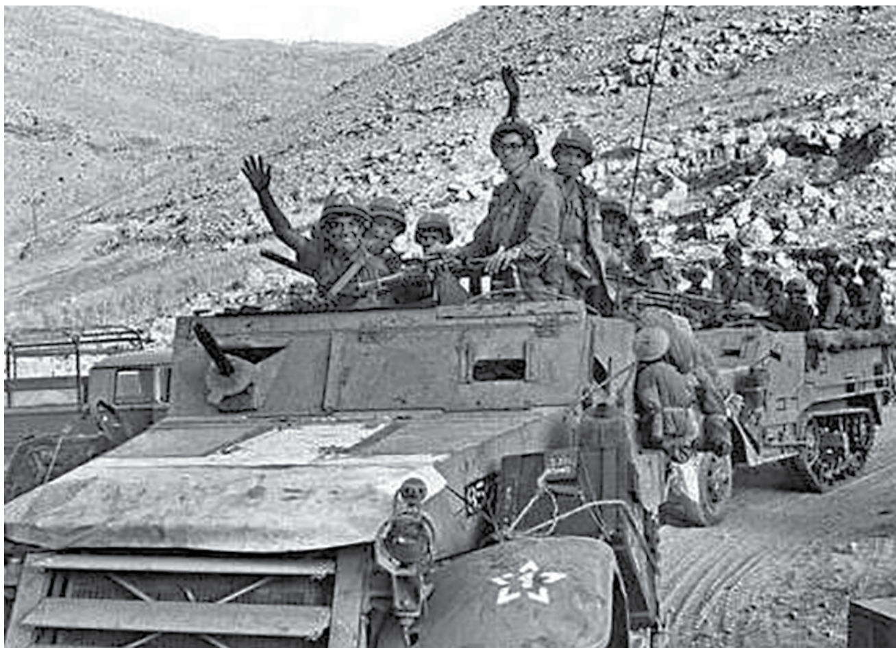
מבצע "קינوح". בחצות הלילה הגיע הגדוד סמוך לנ"ג 2360, והמג"ד דיווח למח"ט כי הגדוד השלים את משימתו.

את משימתו ולהתוודע לכוח שמוקצה לו עבודה. ברוב המקרים הוא עשה זאת ללא היכרות מוקדמת עם המסגרות ומפקדיהן, ובלי שערכו לפני כן אימון משותף.