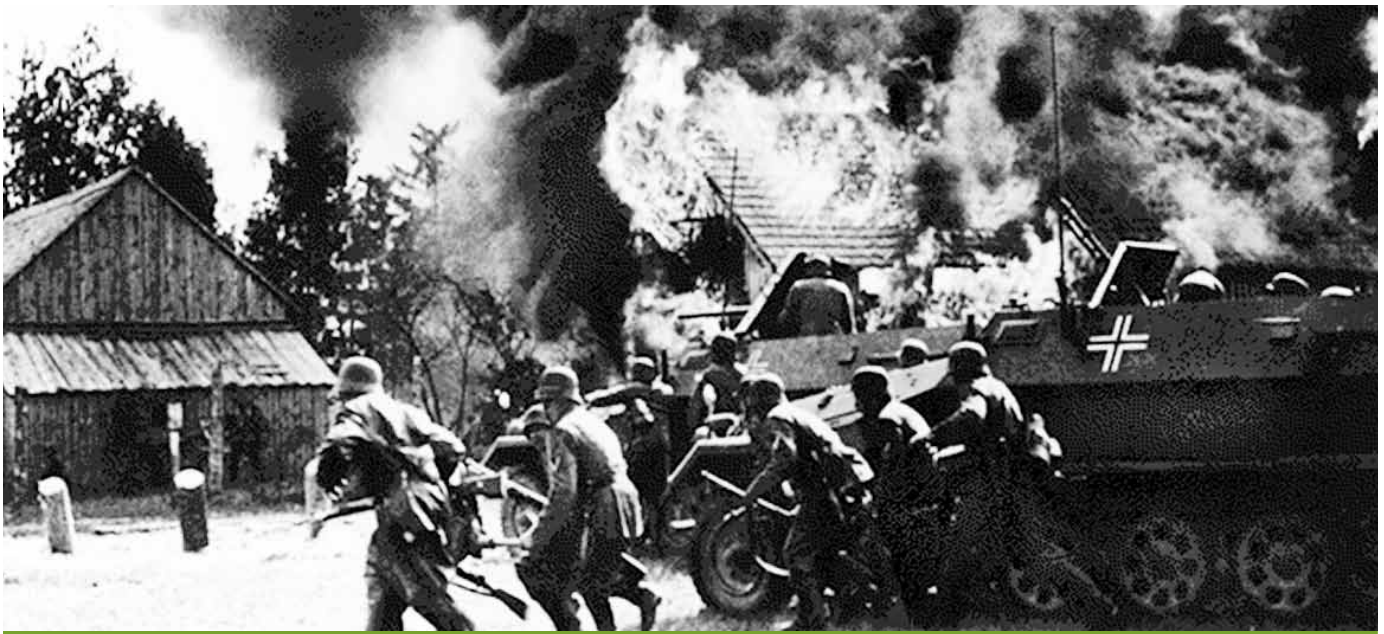
פלישת צבא גרמניה לפולין במלחמת העולם השנייה | "סיכוייה של גרמניה להכריע את פולין בהתקפת בזק אינם טובים", העריך קצין המודיעין האמריקני [ולימים פרשן צבאי מצליח] ג'ורג' פילדינג אליוט במאי 1939

גם טאלב מציין בספרו לחיוב את החשיבה האמפירית - שהיא בטוחה יותר מהערכות - אך גם הוא מקבל שהיא אינה אפשרית בכל תחום, ולעיתים אין מנוס מקבלת החלטות על סמך הערכות והנחות עבודה. המאמר הזה בוחן את תופעת "הברבור השחור" כפי שהיא באה לידי ביטוי בהקשרים שונים במלחמת העולם השנייה. בפרקים הבאים נציג שני מקרי בוחן מהמלחמה הזאת שניתן להגדירם ברבורים שחורים על פי הגדרותיו של טאלב.