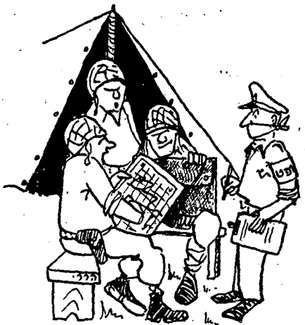
אין השופט רשאי להתערב...

בתרגילי-מפקדות אין מערכת-השפיטה בגדר תנאי חיוני לביצוע התרגיל; קיומה חשוב יותר בתרגילי-סלפונים — כפי שעוד יוסבר להלן — מאשר בתרגילי-קשר. אם הוקצו למפקדה-מתורגלת שופטים, הוי משימתם היחידה היא לבחון את יעילות עבודתה של אותה מפקדה, כדי לאפשר לדרגים-ממונים לעמוד על מידת כשירותה של מפקדה מסוימת.