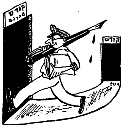
קציני-המטה מקבלים את הכשרתם בקורסים השונים

בהכשרת הצבא לתפקידיו - לאימון-המפקדות מקום נכבד. באם נבחון את התהליך המתודי של הכשרת מפקדות, נראה שראשיתו בהכשרת כל אחד מהגופים שפורטו-לעיל, בתוך מסגרת-הוא. אשר למטה, הרי קציני-המטה מקבלים את הכשרתם בקורסים השונים. אנשי פלוגת-המפקדה ופלוגת-הקשר מקבלים את הכשרתם המקצועית הבסיסית בקורסים, כל אחד לפי מקצועו, והמשך הכשרתם ניתן להם במסגרת יחידתם המקצועית. עד כאן הדבר הוא פשוט למדי. עיקר הבעיה מתעוררת כאשר מחברים את הפרטים או את הגופים יחד, למשימה משותפת, אלא שכאן שוב עלינו להבחין בשני