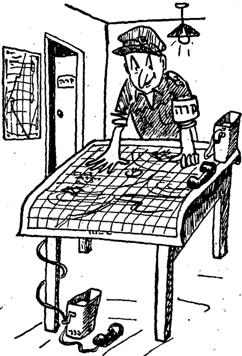
הבקרה קובעת את תגובות האויב

השלב השני מהווה את נקודת-המוקד בבקרה. שלב זה, בגלל עצם אופיו, הנו תמיד מוגבל מאוד בזמן — והיקפה של העבודה הנדרשת בשלב זה מהבקרה הוא גדול מאוד. לאחר מתן פקודות-סופיות במפקדות-המתורגלות יש צורך לתכנן ולעבד את תחזית-המבצעים המפורטת לשלב ניהול-הקרב. עומס העבודה העיקרי מוטל כאן על הבקרה-הנמוכה, המיצגת את הדרגים הלוחמים. עיבוד תחזית-מבצעים מפורטת, הנערכת לכל יום ויום, מושתת על שני יסודות: — תחזית-מבצעים בסיסית — ופקודות המפקדה. הפקודה של המפקדה-המתורגלת, כפי שנתנה לבקרה-הנמוכה, מגותחת כאן על כל פרטיה — והבקרה קובעת את תגובות האויב בשלבים השונים של הקרב וכן את אופן פעולת גייסותינו-אנו, לאור התחזית הקיימת. עבודה זאת מבוצעת לפי שלבי המבצע המתוכננים. לאחר שהבקרה מעבדת את פרטי תחזית-המבצעים המפורטת,