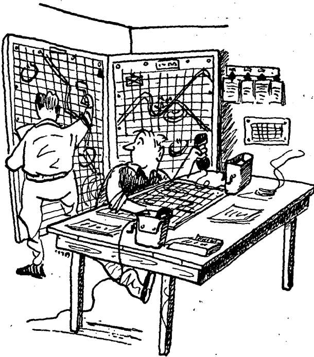
הפעלת חדר מלחמה

* לדוגמה: — בתרגיל חטיבתי מיצגת הבקרה את מפקדת הסיקור לה כפופה החטיבה — ואת הפלוגות של הגדודים אשר מפקדותיהם מתורגלות.