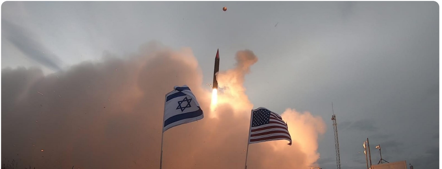
שיגור חץ 3, אלסקה

יש שוני מובהק בין מדינות שונות בתרבות, בהיסטוריה, באיומים, ובמטרות האסטרטגיות. שוני זה משתקף בארגון ממסדי המו"פ שלהם ובאופן פעולתם. כדאי ללמוד מן הניסיון האמריקני המתמיד לעדכן ולשפר את מנגנוני המו"פ, כיצד לא לשקוט על השמרים ולבחון את המבנה, היעדים והתקציבים של מערכת המו"פ הצבאית בהשוואה למדינות אחרות ולתעשיות אזרחיות