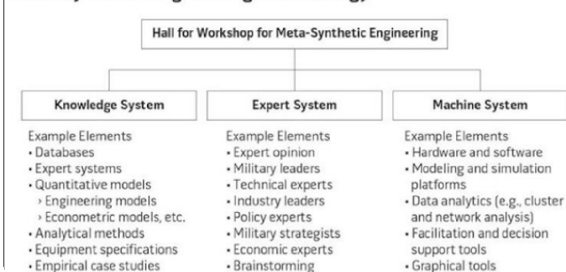
Figure 2. Structure of the Hall for Workshop for Meta-Synthetic Engineering Methodology

בארצות־הברית לעתים המורכבות כה גדולה, נוסף על העובדה שאין מנגנון מובנה כמו HWMSE, כך שיש קושי בקבלת החלטות. לדוגמה, דוח Missile Defense Review מ־2019 שלאחר עבודה של שנתיים לא הצליחו העוסקים בו להתכנס להמלצות ב־11 נושאים מרכזיים.