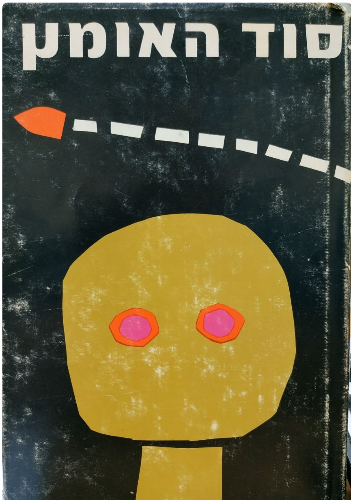
לורד מורן (מאנגלית: יעקב שרת), סוד האומץ, מערכות, תל־אביב, 1970.