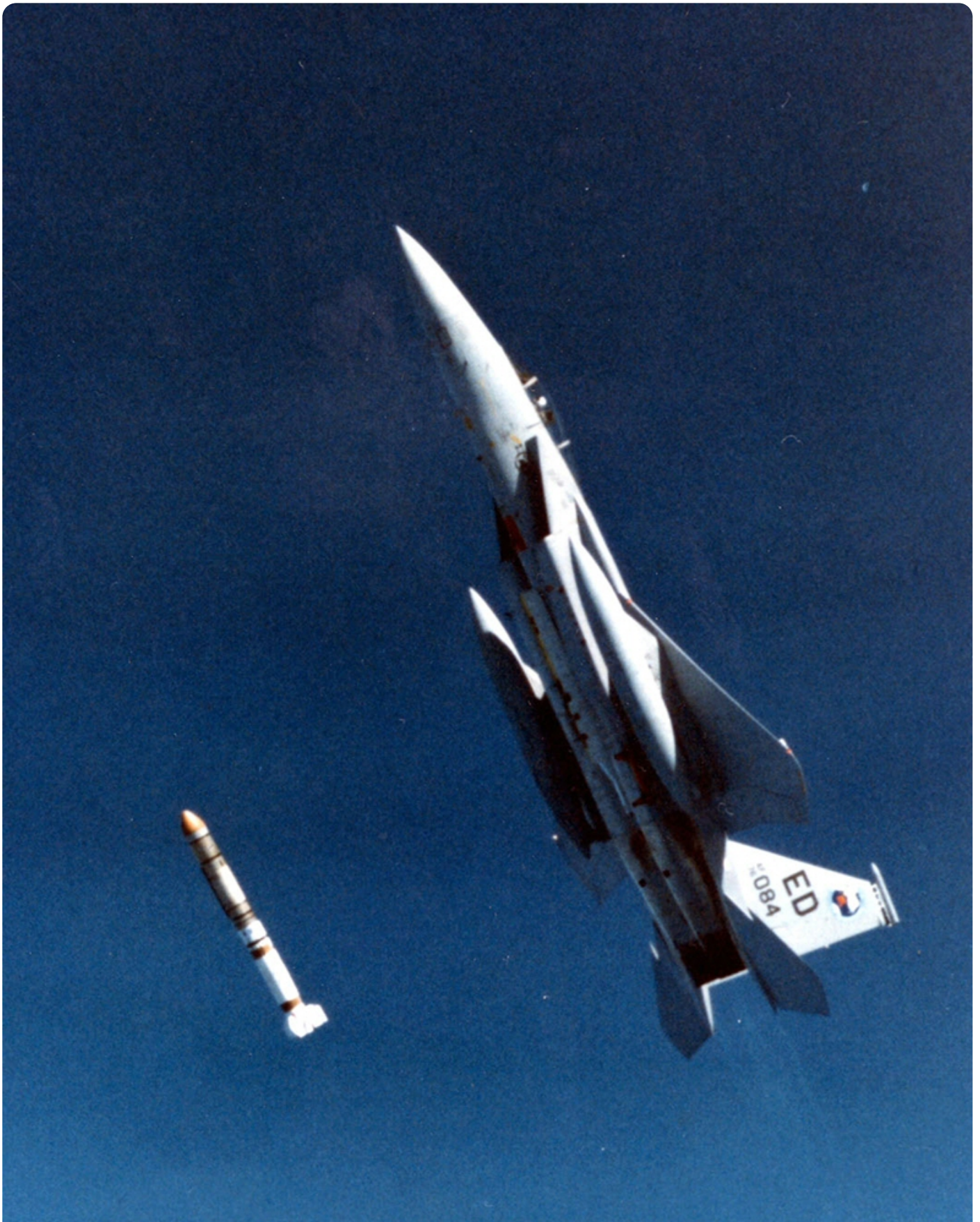
שיגור טיל אנטי לווייני במהלך ניסוי בקליפורניה, 13 בספטמבר 1985

מתוך מו"פ ביטחוני בעולם (לקט עיתונות), נובמבר 2020, המנהל לפיתוח אמל"ח ותשתית טכנולוגית, משרד הביטחון