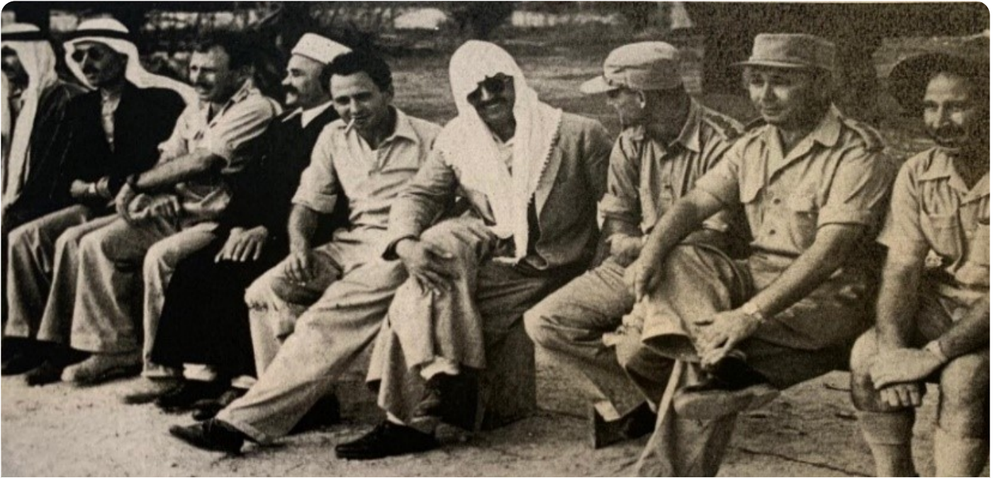
תמונה קבוצתית של מפקדים ואנשי קשר שהביאו לשותפות המבצעית הישראלית-דרוזית