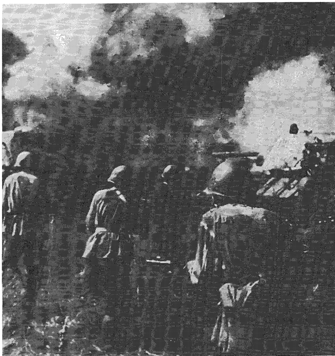
חי"ר סובייטי תוקף בחסות טנקי T-34 בעת מערכת קורסק ביוני 1943. הסובייטים היו חלוצי החשיבה האופרטיבית

מושג ה"סינכרון" מתורגם לעברית כ"תיאום" בגלל העדר מילה אחרת בעברית, שתהיה מתאימה ומדויקת יותר להבעת רעיון הסינכרון. אולם הסינכרון שונה במהותו מתיאום טקטי, שכן הוא מתייחס לרמה אחרת של ניתוח שדה התופעות. הסינכרון, גם כשהוא מתייחס לכוחות פיסיים, עושה זאת ברמת הפשטה שונה מזו של התיאום הטקטי. תורת "המערכה העמוקה" הניחה שהתוצאה המערכתית מושגת על-ידי פעולות שונות שהן מרוחקות או אף לכאורה מנותקות זו מזו בממדי הזמן והמרחב, ובכך יוצרות יחדיו את האפקט המערכתי. המטרה מושגת במגוון של תמרונים ושל