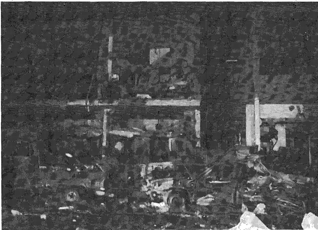
הרס שגרם טיל "סקאד" עיראקי ברמת-גן בעת מלחמת המפרץ

מימד נוסף של נייגודיות משלימה זו בא לידי ביטוי כבר במלחמת המפרץ, כאשר הצבא האמריקני, המצויד במערכות הנשק העכשוויות, היכה את העיראקים בו זמנית בשלוש רמות המלחמה – הטקטית, האופרטיבית והאסטרטגית. הכוחות העיראקיים נאלצו לפעול בחזית, בעומק ובעורף כאילו הם היו מצויים בטווח הוויזואלי, ואם תרצו, בטווח הטקטי, של צבא הקואליציה. ההבחנה המדרגית המקובלת בין קרבות המגע הקרוב, עומק החזית והעורף איבדו ממשמעותם. משקיפים צבאיים מסוימים ראו בכך עדות