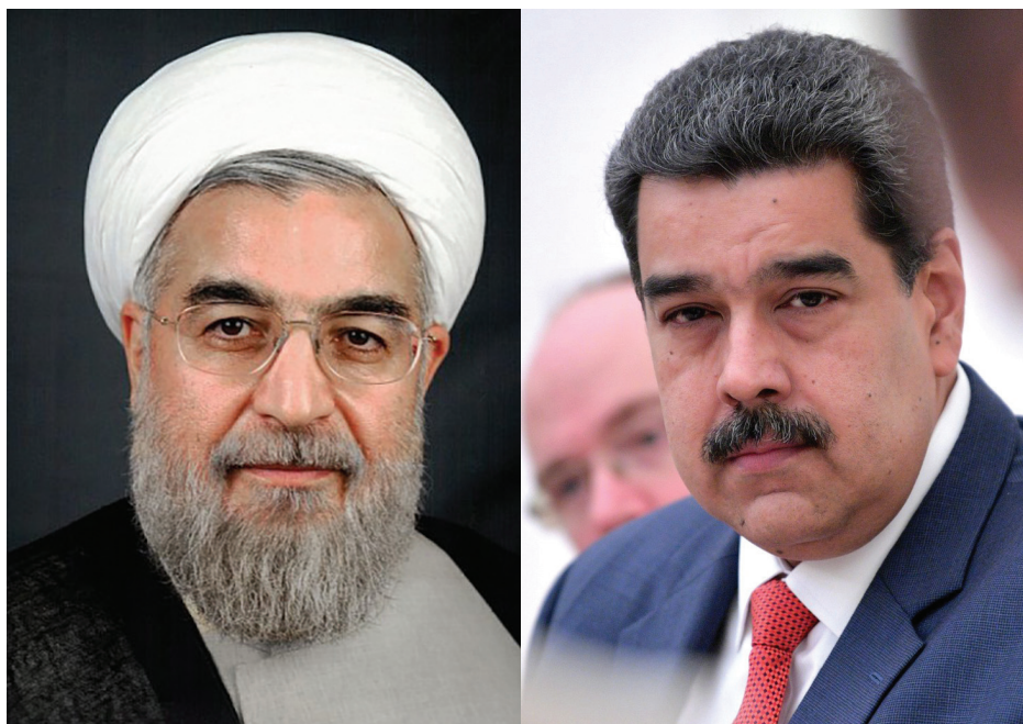
נשיא ונצואלה ניקולס מדורו ונשיא איראן, חסן רוחאני. ההתקרבות האיראנית לאמריקה הדרומית התחזקה באופן ניכר בשנות ה-2000 המוקדמות

בשנים האחרונות חל שינוי מהותי ביחס של מדינות באמריקה הלטינית כלפי איראן, ושלוחיה. טוב תעשה ישראל אם תמנף את המהלך הזה אל מול מדינות נוספות, על-מנת לצמצם את המעורבות האיראנית באזור