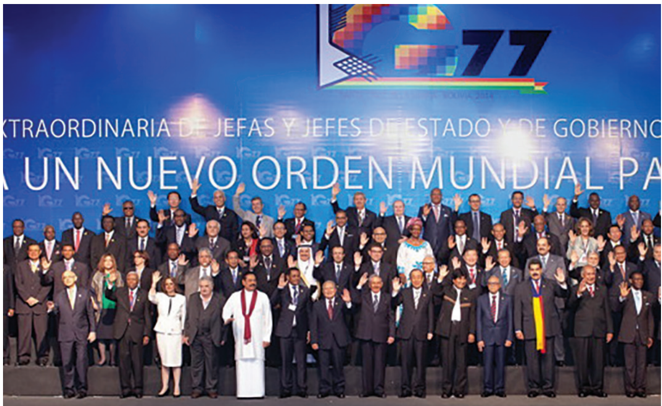
ועידת G-77 בבוליביה ב-2014. היחסים בין איראן ובין מדינות אמריקה הלטינית התמתנו מעט בשנים 2013-2016, כשהנשיא חסן רוחאני החליט לא להגיע לכינוס

התעופה מאהן אייר, הנתונה לעיצומים כלכליים שהטילה עליה ארצות-הברית בגין פעילות עבור משמרות המהפכה. בתמורה, העבירה ונצואלה לאיראן כתשע טונות של מטילי זהב, בשווי של כ-500 מיליון דולר. 17 העסקה השתלמה לשני הצדדים; מבחינת ונצואלה, תוגדל תפוקת הנפט במידה מסוימת, והירידה החדה במלאי מטבעות החוץ אפשרה לה לשלם רק בזהב. ואילו איראן ממילא לא יכלה לעשות שימוש בדולרים או במטבעות מרכזיים אחרים בשל העוצר הכלכלי האמריקני נגדה.