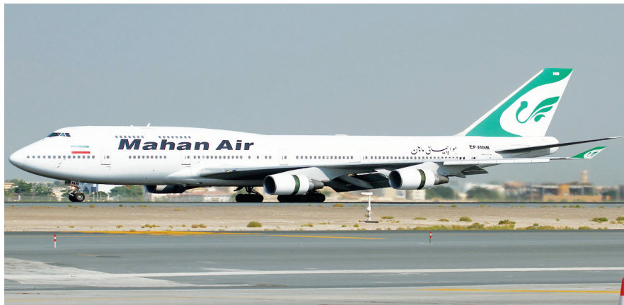
מטוס של חברת התעופה האיראנית מאהן אייר. באפריל 2019 הודיעה החברה כי תשיק טיסות ישירות מטהראן לקראקס

נוסף על כך, על הממשלה לנצל את ההזדמנות שנקרתה לה עם חילופי השלטון ועליית ממשלים תומכי ישראל בשנים האחרונות באמריקה הלטינית – בברזיל, בבוליביה ובאורוגוואי – ולקדם שיתופי פעולה דיפלומטיים, מודיעיניים, תקשורתיים ותרבותיים כמשקל נגד להשפעה האיראנית. כך למשל, בנושא התרבות, ישראל צריכה לעודד יצירת הפקות משותפות בתחום הקולנוע, התיאטרון והאמנות; קידום