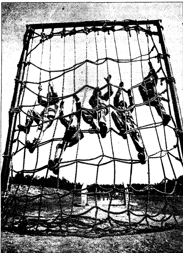
חיילי ה-GSG-9 בעת אימונים

בשירות המשטרה כמשלח יד לכל החיים. המועמדים עוברים תחילה מבחני כניסה הנמשכים יומיים וכוללים בדיקות רפואיות, מבדקים פסיכוכיניים, בדיקות כושר גופני ובחינה פסיכולוגית לבחינת התאמתו הנפשית של המועמד.