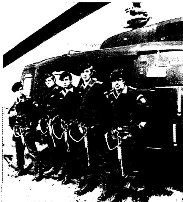
קבוצת משימה מיוחדת של ה-GSG

השירות בגס"ג 9 הוא על טהרת ההתנדבות, והחיילים (ליתר דיוק השוטרים) באים משורות משמר הגבול. תנאי להגשת מועמדות הוא ותק של שנה אחת במשמר הגבול. מדובר אפוא באנשים שבחרו