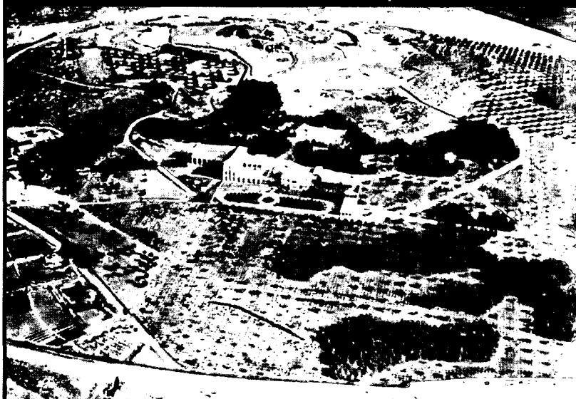
מחדל המודיעין שקדם להתקפה הראשונה על לטרון היה הגורם העיקרי לכישלונה

שבו פתח את הספר "לטרון". בסוף הספר מביא המחבר רשימה של שמות אישים ושל מושגים שנזכרו בספר, המלווים בביוגרפיות קצרות ובהסברים. חבל שהרשימה אינה מסודרת לפי סדר כלשהו, מה שהיה מקל על הקורא לאתר את הפרטים הביוגרפיים הדרושים לו. רשימה זו אומנם מועילה, אך לא תמיד ברור לקורא לפי אילו קריטריונים החליט המחבר מה לכלול בה ומה לא. כך, לדוגמא, מדוע מפקד הלגיון הערבי, גלאב פאשא, או מפקד הלגיון הערבי