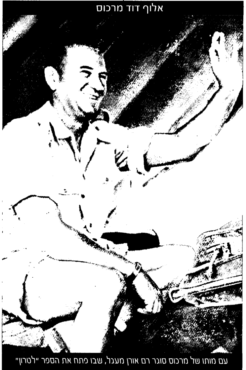
עם מותו של מרכוס סוגר רם אורן מעגל, שבו פתח את הספר "לטרון"

16. שם , עמ' 77, עמ' 134; מוסא, איאם , עמ' 238