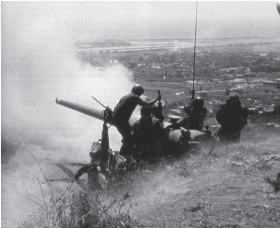
תותחנים באזור ביירות - 1982 מלחמת לבנון הראשונה היא דוגמה למלחמה שבה הושגה הכרעה