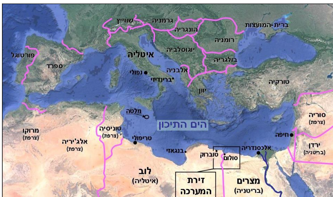
מפה 1: מרחב הים התיכון וזירת המערכה.

מבחינתו של היטלר, מנהיג גרמניה, זירת הים התיכון בכלל וצפון־אפריקה בפרט, הייתה שולית לחלוטין. מעייניו היו נתונים להכנת המערכה החשובה ביותר בעיניו – כיבוש ברית המועצות – שאמורה הייתה להתחיל בקיץ 1941. זירת הים התיכון וכלל זירות המשנה שלה, צפון־אפריקה ומדינות דרום הבלקן, היו עניינה של איטליה. ואולם בעקבות התבוסה הצורבת שנחלו בעלי בריתו האיטלקיים בצפון־אפריקה ובאותה עת גם ביוון, שגם אותה ניסו האיטלקים לכבוש והובסו, נאלץ היטלר להתערב כדי לייצב את המצב בזירה זאת. הוא ביקש להבטיח שבריטניה לא תנצל את התבוסה הכפולה של איטליה כדי לאיים, באמצעות הנחתת כוחות שלה בבלקן, על האגף הדרומי של המתקפה הגרמנית לתוך ברית המועצות. הוא גם חשש שרצף התבוסות עלול לאיים על יציבות המשטר של בניטו מוסוליני, בעל בריתו. היטלר הורה לצבאו לכבוש את יוגוסלביה ואת יוון ולתגבר את האיטלקים בצפון־אפריקה בגיס גרמני אחד. באותה עת החליטו הבריטים לשלוח כוחות ליוון