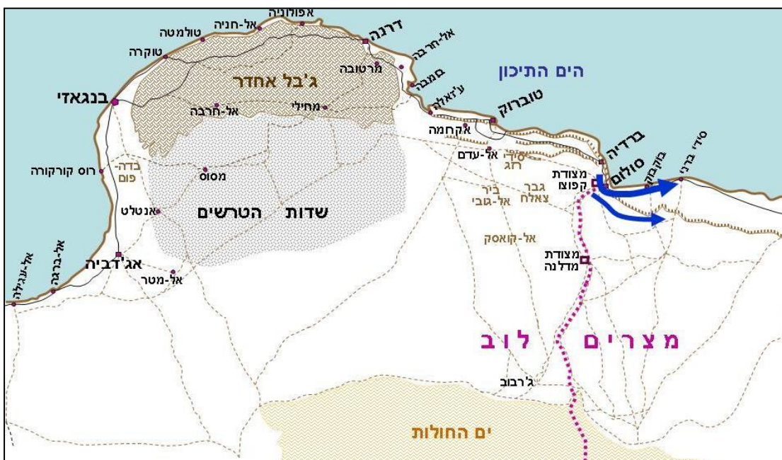
מפה 2: הפלישה האיטלקית למצרים, סתיו 1940.