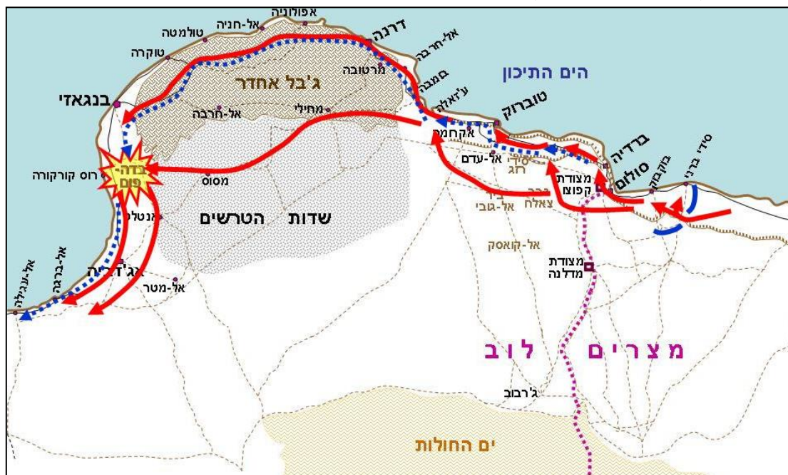
מפה 3: מתקפת הנגד הבריטית, חורף 1940 – אביב 1941.

במקביל למערכה היבשתית התנהלה מערכה ימית חשובה לא פחות. במערכה זו תקפו כוחות האוויר וכוחות הים הבריטיים את ספינות המשא האיטלקיות והגרמניות שהובילו תספוקת, ציוד וחייילים מאירופה לאפריקה. במערכה זו נהנו הבריטים מכך שהאי מלטה, שהיה אז בשליטתם, שוכן בדיוק באמצע נתיבי התעבורה הימית בין איטליה ללוב. כמו כן, הבריטים נהנו מכך שכל תוכניות התעבורה הימית והאווירית הגרמניות-איטלקיות שודרו עלידי הנציג הגרמני באיטליה למפקדה הגרמנית בצפון-אפריקה באמצעות מצפין מסוג "אֶיִנְגְמָה". הבריטים, אשר פיצחו את ההצפנה, יכלו לארוב לשיירות האיטלקיות והגרמניות והטביעו אוניות רבות, עד שלעיתים במהלך שבועות רבים אף אונייה לא הצליחה להגיע ליעדה. להצלחות ולכישלונות במערכה הימית היו השלכות ניכרות ומיידיות על הכוחות הנלחמים בצפון-אפריקה – לעיתים הוגבלה מאוד יכולת הלחימה של הכוחות הגרמניים-איטלקיים עקב מחסור חריף בדלק, בתחמושת ובחלקי חילוף ואפילו בטנקים, תותחים ומשאיות בשלבים קריטיים בלחימה.