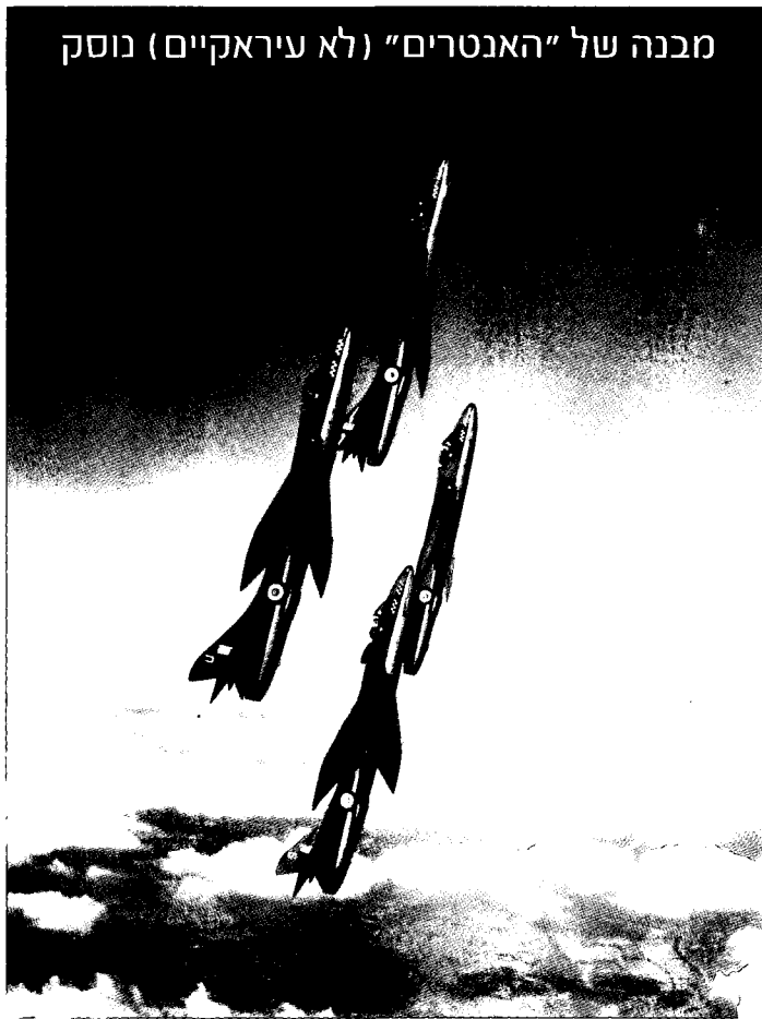
במקביל להכנתו של כוח המשלוח היבשתי לסוריה סוכם גם על סיוע אווירי עיראקי באמצעות שתי טייסות "האנטר"

למלחמת קודש ולגיוס מתנדבים למערכה, והפרשנויות ברדיו בגדאד הוקדשו ברובן הגדול לחשיבותה של המלחמה באויב הציוני.