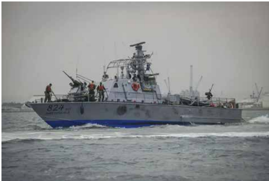
דבורה. דבורת זרוע הים מבצעת פעילות בט"ש עד היום

מטווח רחוק לעבר מטרה בכל גודל שעמדה בקריטריונים ליירוט ונטרול.