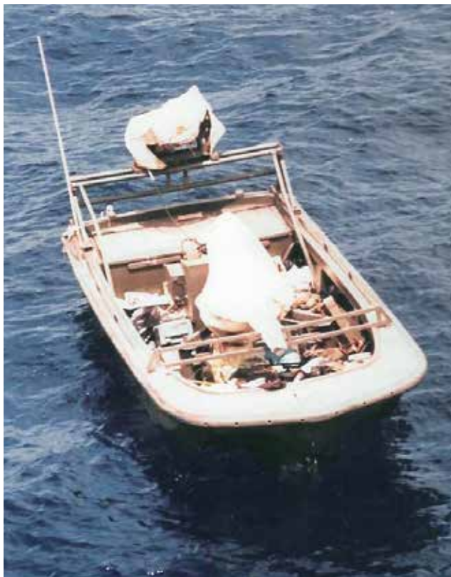
סירת מחבלים המובילה שנתפסה בים מול קיבוץ געש, מאי 1990

עלינו להגן על חופי המדינה וקבע כי נדרש להמשיך ולפתח את המענה הטכנולוגי, אך סייג את דבריו באמירה: "יש לפעול מתוך נקודת הנחה שלא ניתן להגיע להגנה הרמטית על החוף" 17 . אמצעים טכנולוגיים שמטרתם לשפר את יכולות הגילוי והתצפית ולשדרג את יכולות התמרון והמהירות של כלי השייט קרמו עור וגידים והתוצאות לא איחרו לבוא. אמצעי ראיית לילה "בלוט" הוכנס לשימוש בתחילת שנות ה-90 של המאה ה-20, ולראשונה התאפשר לתצפיות חיל הים לבצע תצפית אפקטיבית בלילה עד כדי יכולת לגלות שחיין במים.