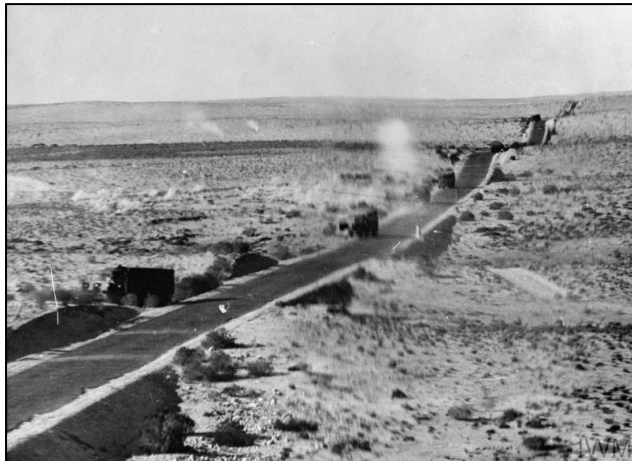
צילום 11: שיירת משאיות הספקה גרמנית או איטלקית מותקפת על-ידי מטוס בריטי. (צולם על-ידי המטוס)

אפריקה קיבלו עדיפות קלה בהצטיידות במשאיות, אבל גם עדיפות זו העמידה לרשותם מספר מצומצם מדי של משאיות ביחס לצורכיהם. למעשה, לפי מחקר אחד שנערך בנושא, נראה שמגבלת כמות המשאיות גרמה לכך ששיעור ניכר מהציוד והמצרכים שנפרקו בטריפולי אפילו לא הגיע לחזית. 20 קצב הפריקה מהאוניות עלה על הקצב המרבי שבו יכלו המשאיות הזמינות להוביל את מה שנפרק לכוחות