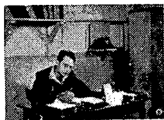
5. השליש הוא סגן מישור.