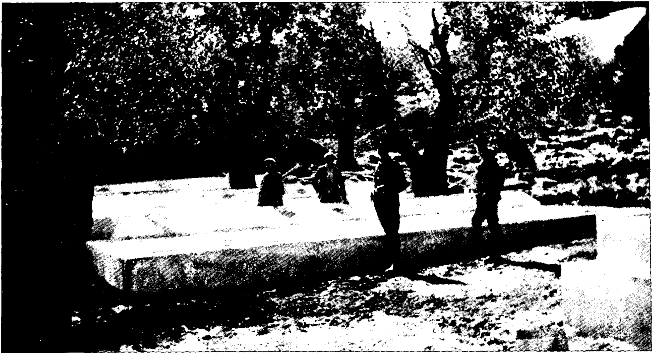
שוטרים יהודים שומרים על פועלים יהודים העוסקים בהכנת קבר אחים להרוגי מאורעות תרפ"ט (1929)