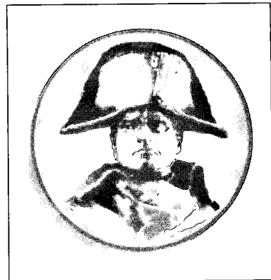
נפוליאון: היחס בין הגורם הרוחני (האיכותי) לגורם החומרי במלחמה הוא אחד לשלושה

הקריטריון השלישי, שלכאורה מקנה למעטים בתנאים שלנו יכולת להכריע את הרבים, זהו הנשק שבסיפור של גדעון מצטייר כך: לא הקשת ולא הרובה, לא הכידון ולא הרומח, אלא נשק שאיש לא שמע עליו בכלל: לפידים בתוך כדים אשר יוצרים מהומה וכו'. בהקבלה לתקופתנו, כאן טמון אולי האתגר הגדול ביותר העומד בפנינו בשטח של האיכות מול הכמות, וזאת מאחר שיש גבול מסוים לכל הקריטריונים האחרים. סיפור דוד וגוליית מלמד רק דבר אחד: בשטח הנשק עולה האיכות בתנאים מסוימים על הכמות. קלע של רועה בעל טווח, אין שווה לו בכל כלי-הנשק הכבדים קצרי הטווח. ויש דוגמאות רבות לכך בהיסטוריה.