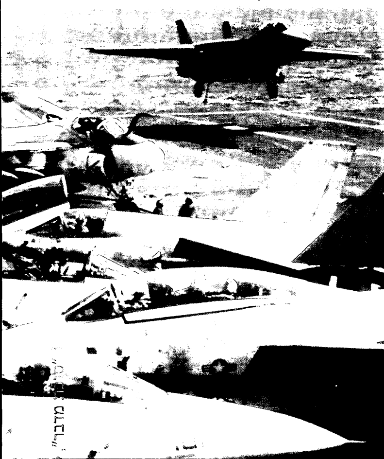
"סופת מדבר", קוסובו ואתגר השינוי

הצי, אשר רכש מטוסי קרב חדישים ונושאות מטוסים חדשות, צפוי להמשיך באופן בסיסי לפעול ב־50 השנים הקרובות באותה דרך כמו היום