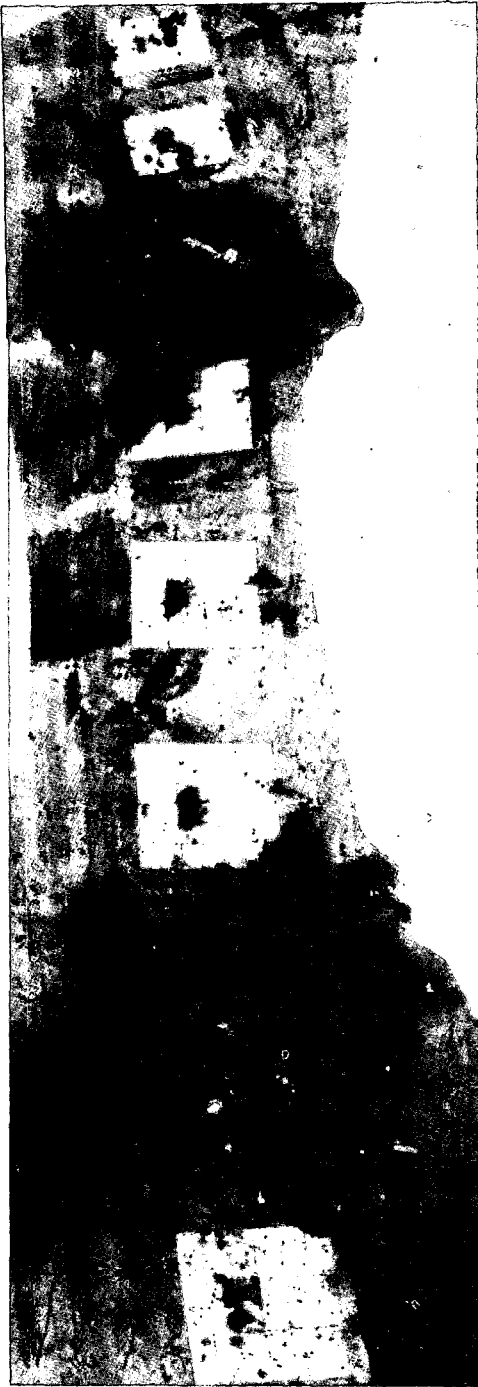
פגיעות חיל-האוויר במטוסים מצריים על הקרקע במלחמת ששת הימים. הלקח היה צריך להוביל לשיתוק חילות האוויר הסודי והמצרי, מיד עם פתיחת מלחמת יום הכיפורים.

בתו"ל) X היה מוצלח במיוחד (תקיפת מטוסי האויב בשדותיו בפתיחת הלחימה). השימוש במודל להפקה ישירה של לקחים מהצלחה בולטת יביא אותנו למסקנה ("לקח"), כי זו טקטיקה רצויה גם במלחמה הבאה. אבל, מה שהיה מוצלח מאד מבחינתנו היה כמעט אסון מבחינת האויב. עבורו זה היה כישלון חמור.