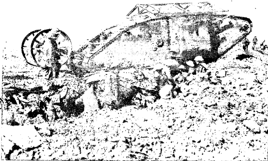
הטנק הוטל לראשונה לקרב במערכת הסום. מתוך כ־30 כלים התקלקלו 9 ו־14 נחקעו בחפירות ובמכשולי קרקע טבעיים.

שבמלחמה מסוימת הכנסנו לראשונה טיל חדר נ"מ מסוג מיוחד, ששמו כינמת (כתף, יכולת נגד מטוסים, מפתיע), המתבסס על טכנולוגיה חדשה ומפתיעה. עד פרוץ המלחמה הספקנו לצייד כעשרים חוליות בטילים הללו. בסיום המלחמה נערך תחקיר יסודי, ובו מתברר, כי "כינמת" נחל הצלחה יוצאת דופן: כמעט כל 20 החוליות הצליחו לקיים מגע עם מטוסי האויב ולירות בהצלחה את כל הטילים שברשותן. למעשה, רק חוליה אחת לא הצליחה לירות את טיליה, ואילו כל השאר פגעו כתשעה טילים מתוך העשרה, שעמדו לרשותן, למרות שהשיגורים בוצעו בתנאי שטח ותאורה מגוונים ביותר.