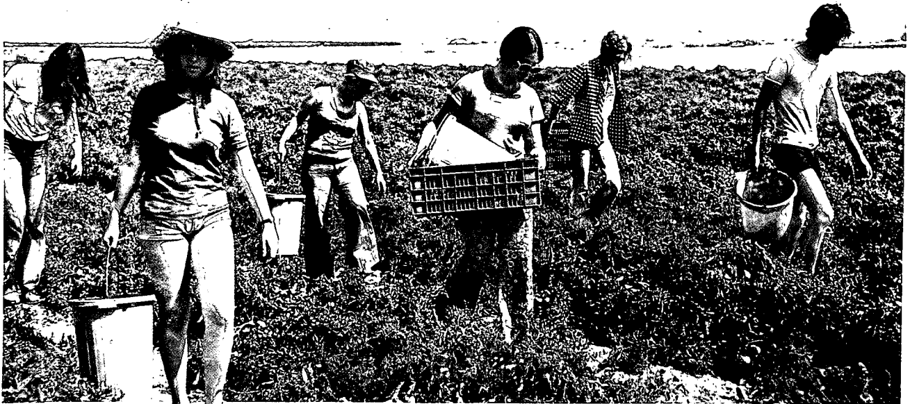
גדנעים בשירות לאומי: המחויבות החברתית טובעה במהותו של צה"ל