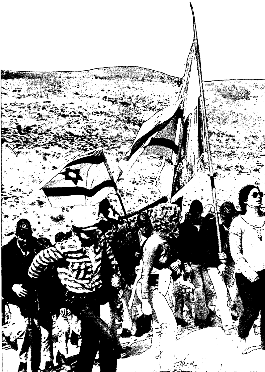
מסע גדי"ע להכרת הארץ

גישתו זו של דיין כבר באה לידי מיצוי חד משמעי בתקופת פעולות הגמול, תקופה שבה מתגבשים מחדש דפוסי הלחימה של צה"ל, נורמות הלחימה ורוח הלחימה. לדיין כרמטכ"ל ולצנחנים היה תפקיד מכריע בתהליך זה.