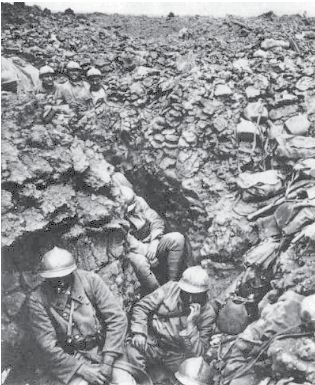
הרגימנט הצרפתי ה־87 בחפירות במהלך קרב ורדן. הפקודה שנתן פטן לחיילי הייתה להחזיק בכל מחיר, ולכבוש מחדש כל שעל שעליו האויב משתלט

בין הגרמנים התנהל ויכוח בשאלה איך להכניע את פריז: באמצעות לחימה וכיבוש, באמצעות הפגזות או באמצעות מצור ורעב. החיילים