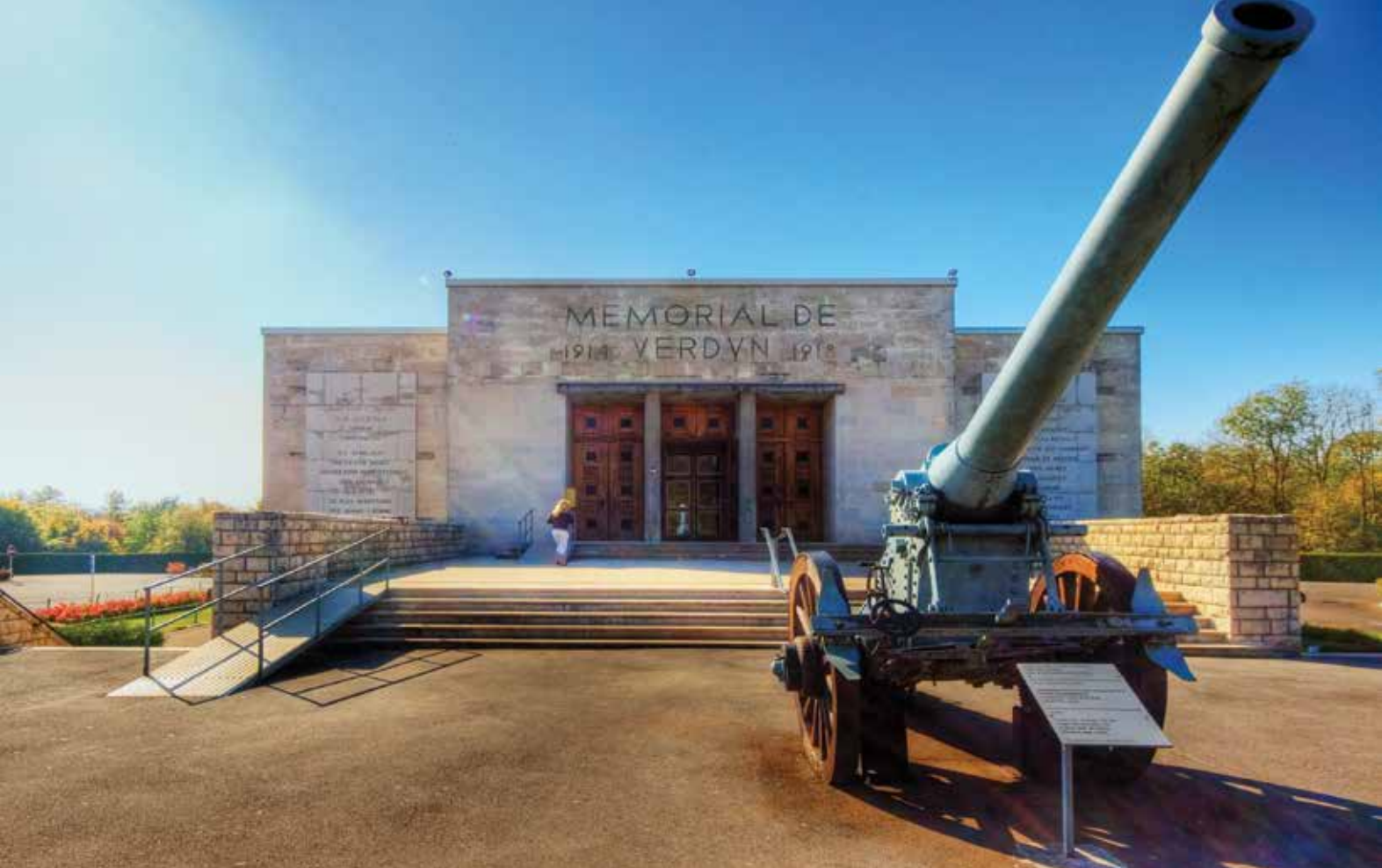
מצבת הזיכרון של ורדן. במהלך המערכה ספג כל אחד מהצדדים מאות אלפי אבדות, אך יצא ממנה ללא הישג משמעותי.

וילהלם, ביקשה לקבל כוחות נוספים כדי להרחיב את ההתקפה בגדה המערבית. בתחילה סירב פאלקנהייין מכיוון שהתוכנית הייתה לשמור את העתודות ולהשתמש בהן כדי לתקוף ולהכריע רק אחרי שהצרפתים יתשו. פאלקנהייין היה מוכן לעצור, לוותר על כיבוש השטח השולט ולהודות בכישלון התוכנית, אבל הארמיה ה־5 שכנעה אותו שאי אפשר לעצור מכיוון שהעמדות גרועות וקשה פסיכולוגית לעמוד במקום. צריך לתקוף ולהתקדם או לסגת. 21