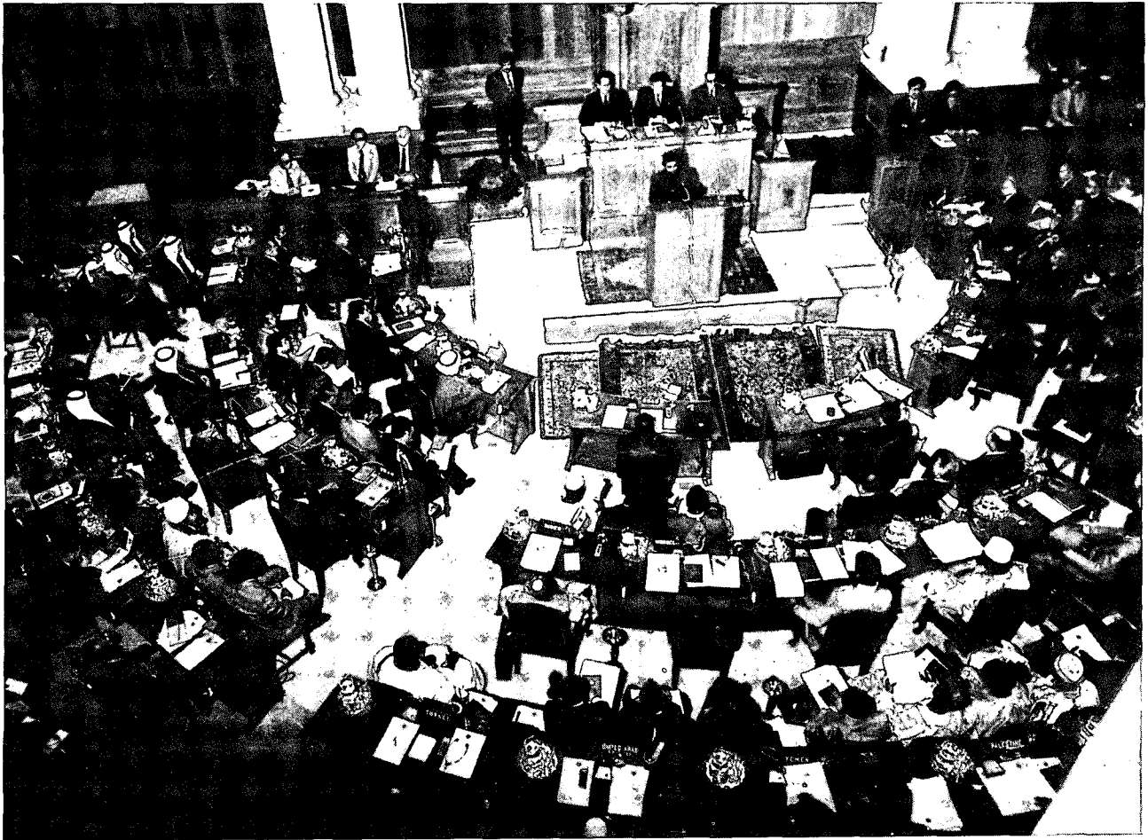
ועידת פסגה מוסלמית בלאהור, 1974

נמשכו שישה חדשים בהשתתפות גורמים מהגדה המערבית ומאש"פ. באוגוסט 1973 פורסם מצעה של „החזית הלאומית” שקבע כי היא מהווה חלק בלתי נפרד מאש"פ. באותו זמן קרא אש"פ לתושבי השטחים להתארגנות פוליטית, חברתית ותרבותית, „להשתלבות פעילה ביותר במאבק נגד ישראל בכדי להקל על הפיכת תנועת ההתנגדות הפלסטינית באדמה הכבושה למהפכה המונית מאורגנת ומוזינת”. האוכלוסיה בשטחים נקראה להיחלץ לטיפוח קאדרים לאומיים חדשים בעלי עמדה פרו-אש"פית. בין הגורמים שהביאו לבסוף להקמת „החזית הלאומית הפלסטינית” יש להזכיר שני תהליכים חשובים: א. הידוק הקשר בין אש"פ ובין ברה"מ בראשית שנות ה-70. ב-1972 הגיעה ההידברות ביניהם לרמה גבוהה של אינטנסיביות ואינטימיות וכתוצאה מכך חלה התקרבות של אש"פ גם למפלגות קומוניסטיות ערביות וגם למפלגה הקומוניסטית (הירדנית) בגדה המערבית. ב. התגבשות המפלגה הקומוניסטית בגדה המערבית מבחינה ארגונית ואידיאולוגית. ב-1972 חדל, למעשה, להתקיים ארגון המחבלים שהקים הפלג הלניניסטי של המפלגה הקומוניסטית הירדנית (שהמפלגה בגדה המערבית נחשבה כסניף שלה), בלא שהצליח לזכות בייצוג כלשהו באש"פ. מאז התחולל במפלגה מאבק פנימי שהגיע לשיאו בסתיו 1973, כאשר המפלגה בגדה המערבית החלה מופיעה תחת השם „המפלגה הקומוניסטית הפלסטינית”. בהיותה הגוף הפוליטי המאורגן היחיד בשטחים, הפכה המפלגה