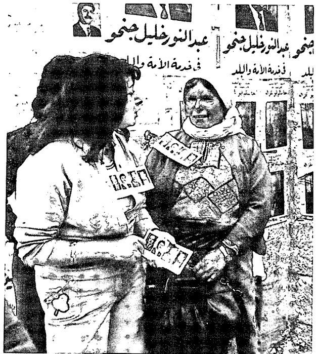
תעמולת בחירות לעיריות בגדה, אפריל 1976

ערבית אוניברסיטאית במוסדות חינוך בגדה המערבית, כדי לצמצם את ממדי יציאת התלמידים מהאיזור ללימודים במדינות ערב ובחור"ל. עובדה מעניינת היא שבמקביל לפעילות זו חלו שינויים בהרכב מועצות הנאמנים של כמה ממוסדות החינוך הגבוהים בגדה המערבית, כאשר תומכי אש"פ רכשו עמדות השפעה בולטות במוסדות אלה, דבר שהתבטא בפעילות עוינת רבה יחסית של תלמידיהם ומוריהם. ההתפתחות החשובה ביותר בהקשר זה היא החלטת „המועצה הלאומית הפלסטינית“ (מרס 1977) לפעול למען הקמת אוניברסיטה ב„שטחים כבושים“. בעבר התנגד אש"פ לרעיון זה בתוקף, בחששו שמוסד כזה יהיה בחסות ישראלית על כל המשתמע מכך. יש מקום להנחה שהשינוי בעמדת אש"פ בשאלה זו נובע בין השאר מהרגשת ביטחון בהשפעתו על המוסדות החינוכיים הגבוהים הקיימים כיום ברצועת עזה ובגדה המערבית (קולג' ביר זית, קולג' „פרייר“ בבית לחם והמכללה ע"ש טוקאן בשכם) והאמורים להרכיב את „האוניברסיטה הפלסטינית“. הרגשת ביטחון זו, אם היא אמנם קיימת, יונקת בלי ספק עידוד מההערכה של אש"פ שיש ביכולתו לגייס את הכספים הדרושים למפעל זה, כמו גם את האישורים הערביים המתאימים מבחינה אקדמית ומדינית, שיעניקו למוסד מעמד רשמי ומוכר בעולם הערבי.