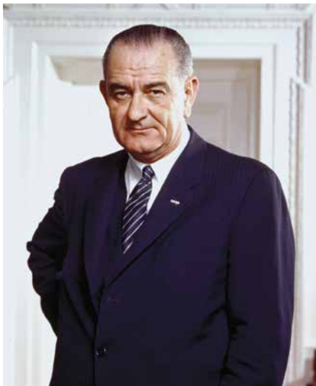
נשיא ארצות הברית, לינדון ג'ונסון. רצונותיו של האמיר פייצל (לפני מינויו למלך) נפגשו עם ראייתו של ג'ונסון את הדברים

בעקבות כישלון תוקפנות זו, עברה התעלה לשליטה מלאה של מצרים. נאצר ביטל את הסכם הפינוי, השתלט על הבסיס הבריטי בתעלה וכך הסתיימה ההשתלטות המצרית על הכניסה הצפונית לים האדום. השלב הבא היה ההשתלטות המצרית על הכניסה הדרומית לים האדום במצרי כאב אל-מנרב. הדרך מזרחה לסיני עבור הצבא המצרי נפתחה, ללא כל איום מצד בריטניה על הכוחות המזוינים המצריים, וישראל הפכה לאויב העיקרי של מצרים.