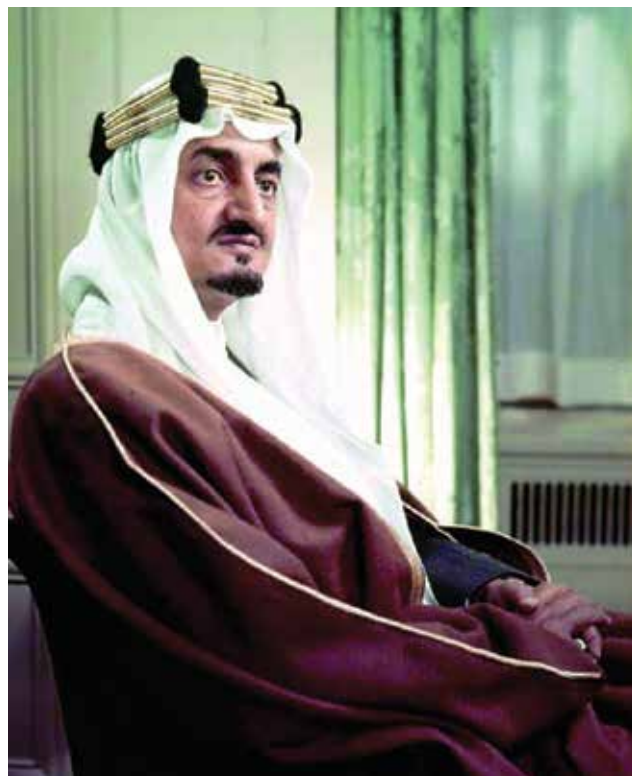
מלך ערביה הסעודית, פייצל. המסר העיקרי מהמכתב: "עוד לפני שתגיע שנת 1970, כיסא המלוכה והאינטרסים הסעודיים לא יהיו קיימים יותר"

בנובמבר 1962 חתמו מצרים והמשטר הרפובליקני החדש בתימן על הסכם הגנה בין שתי המדינות, שבו מתחייבת כל אחת מהן לסייע לשנייה במידה ותותקף. חתימת ההסכם לוותה בהתגרות בערב הסעודית, כאשר נשיא תימן החדש עבדאללה אל-יסאלל, שעמד בראש ההפיכה, הכריז שהמהפכנים התימנים החליטו לשחרר את הארמות הקדושות של מכה ואל-מדינה. לטענת הסעודים, היו למצרים תוכניות נוספות לפגוע בערב הסעודית, וזאת עליידי החדרת כלי נשק עבור גורמי אופוזיציה