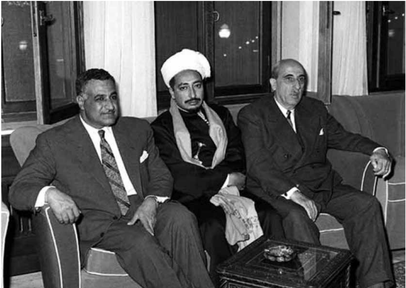
נשיא מצרים גמאל עבד אל נאצר ליד נסיך הכתר האמאם מוחמד אל-בדר מצפון תימן, פברואר 1958. נאצר אף איים בנאום פומבי כי מצרים תמשיך להפציץ מטרות בשטח ערב־הסעודית, אם זו לא תפסיק את סיועה למלוכנים

המלך מתאר במכתב את פגישותיו עם נשיא מצרים במהלך 1964, בוועידת הפסגה הערבית ובוועידת המדינות הבלתי מזדהות שנערכו במצרים, ואת ההסכמים שהושגו בהן בין שתי המדינות שנועדו לפתור את כל הבעיות שביחסיהן, ובכלל זה פתרון המשבר בתימן, הסגת הכוחות המצריים ממנה והפסקת התעמולה נגד הממלכה. דבר מכל אלה לא התממש.