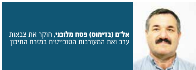
אלים (בדימוס) פסח מלובני, חוקר את צבאות ערב ואת המעורבות הסובייטית במזרח התיכון

מצרים תמכה בכל הגופים הפוליטיים בסומליה, סייעה להם רבות