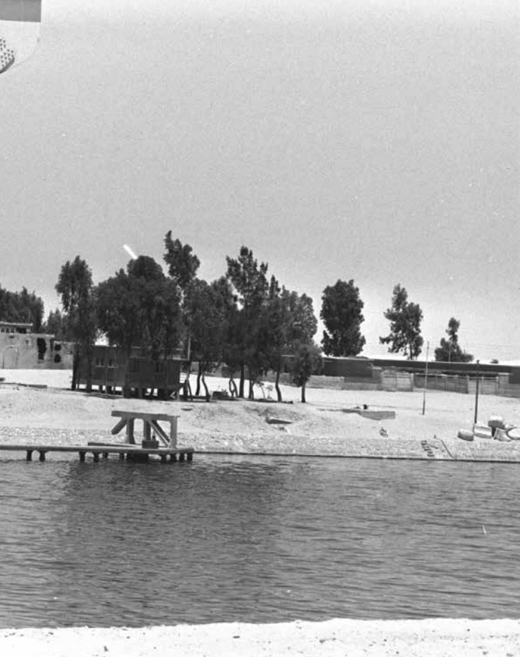
תעלת סואץ. הדבר שהביא לתוקפנות המשולשת" על מצרים - מלחמת סיני

כמו כן נכתב שידוע להם על איומיו של נאצר לתקוף יעדים בערב הסעודית, והם הביעו שוב את תקוותם שלא תהיה התנגשות צבאית בין שני הצדדים. בעקבות הפצצות של מטוסים מצריים על נג'ראן ב-27 בינואר 1967, פנו האמריקנים למצרים והביעו את דאגתם מפני הישנות מקרים כאלה בהמשך, וציינו שהרבר עלול לפגוע ביחסי ארצות-הברית-מצרים.