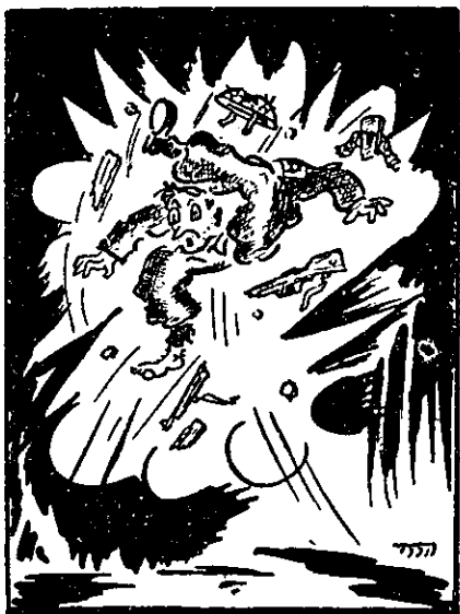
„מענין לדעת מאיזה סוג המוקש?“

שגרת חיי המחנה הצבאי מתחילה מעצם השלב הראשון של הכשרת הטירון באסכולת־הטירונים: סיגולו לסדר, משמעת, לידיעת כלי נשקו, לשדאות־