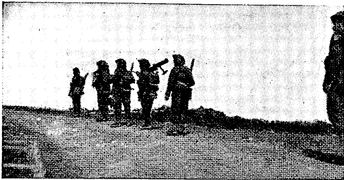
פטרול-קרב של החי"ל במפנה דרך

תנאי המלחמה שנתרגשה עלינו, היתה פרי התפתחות המחשבה הצבאית מימות-בראשית של ארגון ההגנה, משך תקופה רבת שנים של מחשבה עצמית, שפותחה וטופחה — כמעט בלי יכולת להשען על התפתחות ההלכה והמעשה הצבאיים בצבאות העולם — באורח עצמי, שלב שלב ונדבך נדבך, בהתאם לחליפות ול-תמורות בנתוני היסוד של מצבנו הצבאי (או ה"לפני צבאי"). אכן, יצוין כי שינויים כאלה בתכניות הארגוניות ובמבנה, ובשיטות ההגנה של ארגון ה"הגנה", כמעט ולא נבעו מתמורות במצב היסוד והחימוש, שלא נשתנו אלא במעט ובהדרגה בכל התקופות האלה.