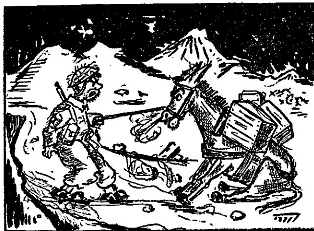
„אל תהיה אנטישמי“

והרי הערה אשר מהראוי להעיר בפתח דבר. בארצות אירופאיות רבות, (צרפת איטליה ועוד), התנגשו בתקופה ידועה שתי אסכולות, ילידות