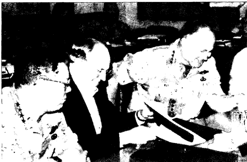
ריצ'ארד צ'ייני, שר ההגנה (במרכז), גנרל קולין פאוול, ירד המטות המשולבים (משמאל), וגנרל ה' נורמן שווארצקופף, מפקד הפיקוד המרכזי של ארצות-הברית, שבוע לפני סופת מדבר

עבור צה"ל יש חשיבות רבה במעקב ובהפקת הלקחים מהמלחמה בהיבט חשוב. זו המלחמה הראשונה במזרח התיכון, שבה נעשה שימוש מסווי במערכות נשק מדויק,