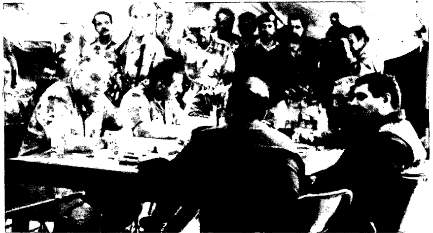
גנרל שווארצקופף והנסיך גנרל חאליד מסעודיה בדיוני הפסקת-האש עם גנרלים עיראקיים

בתקופה הראשונה לאחר המלחמה העריכו רבים בישראל, כי תוצאותיה מספקות לישראל פסק-זמן לא קצר, שבמהלכו קטן האיום עליה. ההערכה זו נבעה מנתונים על הפגיעה הגדולה בצבא עיראק, ומההנחה, כי עיראק הוצאה מהמשחק הצבאי באזור לכמה שנים. הפגיעה בצבא עיראק נתפסה בישראל כה גדולה עד שניתן לגרוע את עיראק מרשימת השחקנים, העלולים לגבש חזית מזרחית מול ישראל. אולם, לאחר כמה חודשים החלה