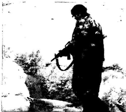
איש הכוחות המיוחדים האמריקניים מטהר תעלה