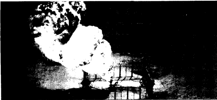
שדה נפט, שהוצת על ידי העיראקים

הופעלו בראשונה סוגים מסוימים של חימוש מדויק. ניתוח ביצועיהן ולימוד תורת הלחימה, שבמסגרתה הפעיל חיל האוויר האמריקני את מערכות הנשק החדשות באוויר וביבשה, יכולים להועיל לצה"ל מאוד.