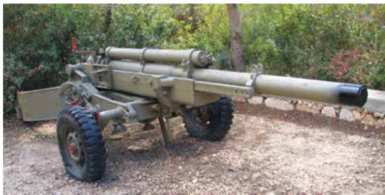
תותח M-102. בצה"ל הבינו כי שימוש במרגמה כבדה הוא אפקטיבי פחות מתותחים.

קצח"ר, את התותחנים וגם שישה חיילי מילואים של סירת מטכ"ל, שתפקידם היה לאבטח את אזור הפעולה. הכוח נשא איתו שני תותחים. 6 הנקודה שנבחרה לא התאימה לתקיעת יתדות שמייצבות את התותחים, והמסוקים הנחיתו את הסוללה ביעד החלופי. היתדות נתקעו בכוח רב, חלקן נשברו וחלקן יצאו