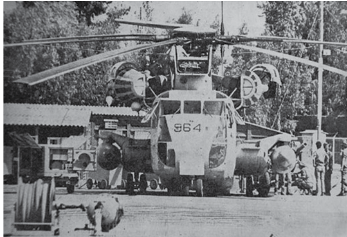
העמסת תותח M-102 על מסוק יסעור בזמן מלחמת יום הכיפורים כחלק ממבצע "פונטיאק". הכוחות המבצעים לא היו אורגניים ולא התאמנו יחד, אלא חברו אד-הוק לביצוע המשימות.