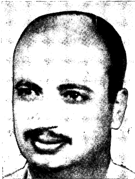
תפקד „פתח“, יאסר ארפאת

ובעל דעות פרקטיות מתונות-ביחס, שנולד ב־1909 בליפתא על־יד ירושלים, ונאלץ, בשל דעותיו, להימלט מירדן ולבקש מקלט בטוריה או בעיראק, בתקופת האיחוד הקע"מי. למעשה נבחר המודה כמועמד של פשרה וכמנהיג־מעבר, שיעמוד בראש הארגון עד לבחירת יו"ר חדש בבחירות הראשונות שתיערכנה בארגון.